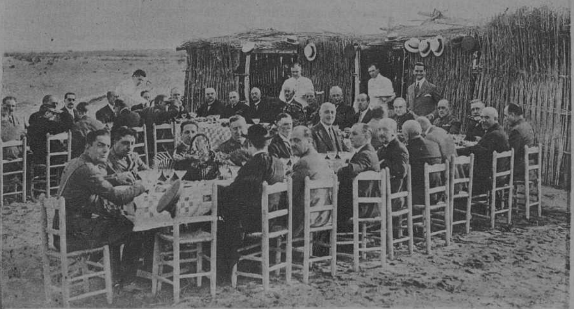
Barcelona.- Lunch ofrecido al general Primo de Rivera, por las autoridades, en los terrenos del Puerto Franco.