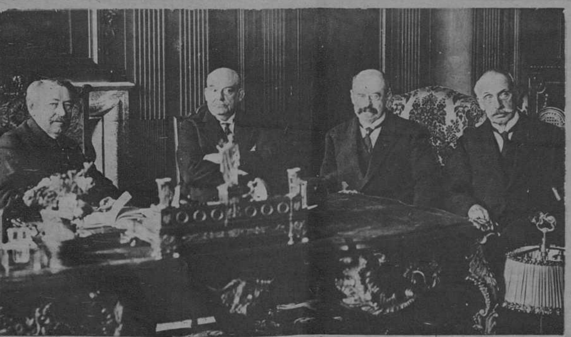
París.- Conferencia celebrada entre los Srs. Briand y Vandervelde, para tratar de la estabilización del franco francés y belga.