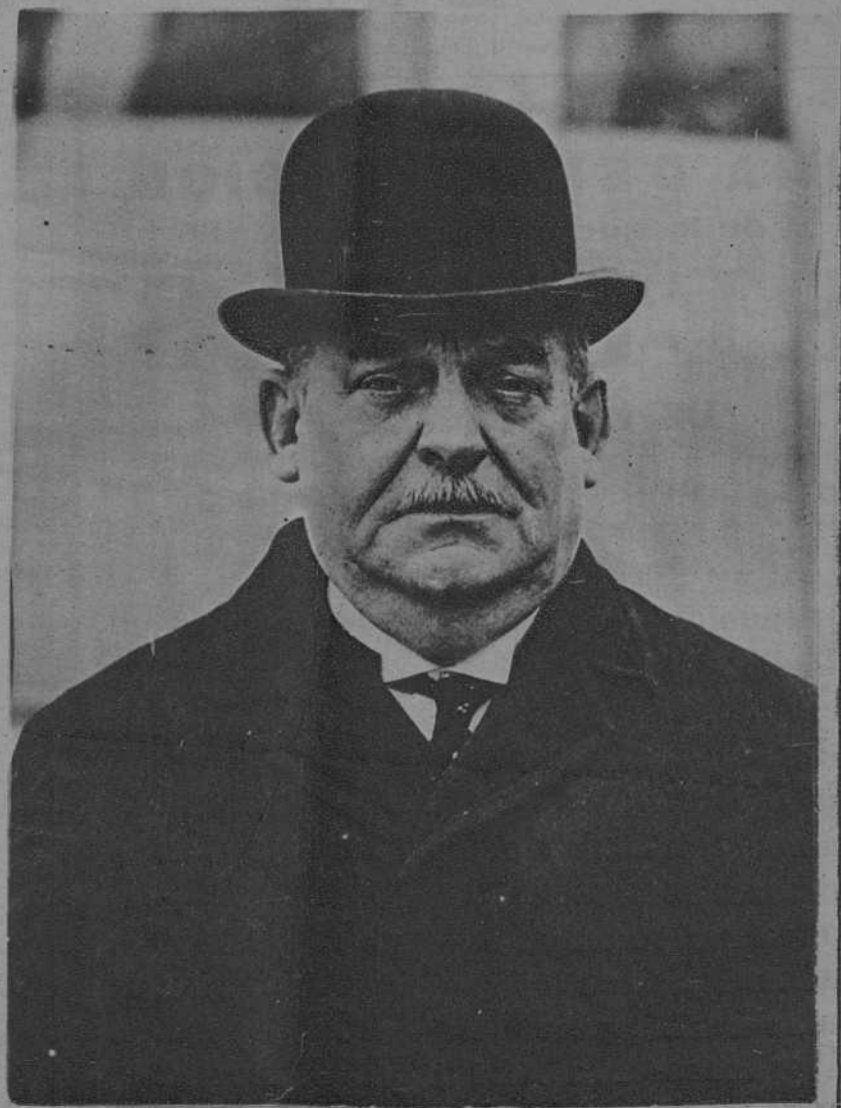
M. Francqui, Ministro belga que asiste a la conferencia de la estabilización del franco.