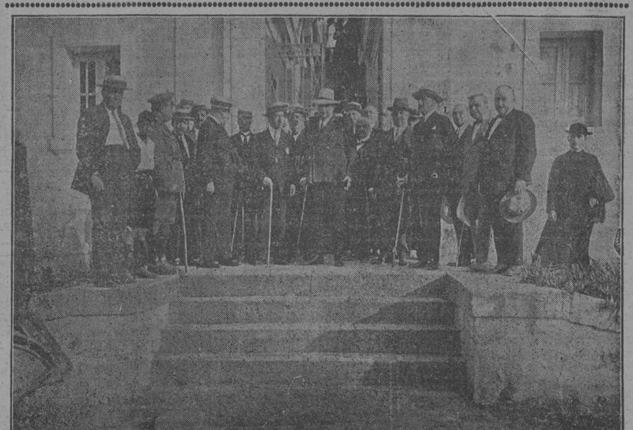
Primo de Rivera en los terrenos del Puerto Franco