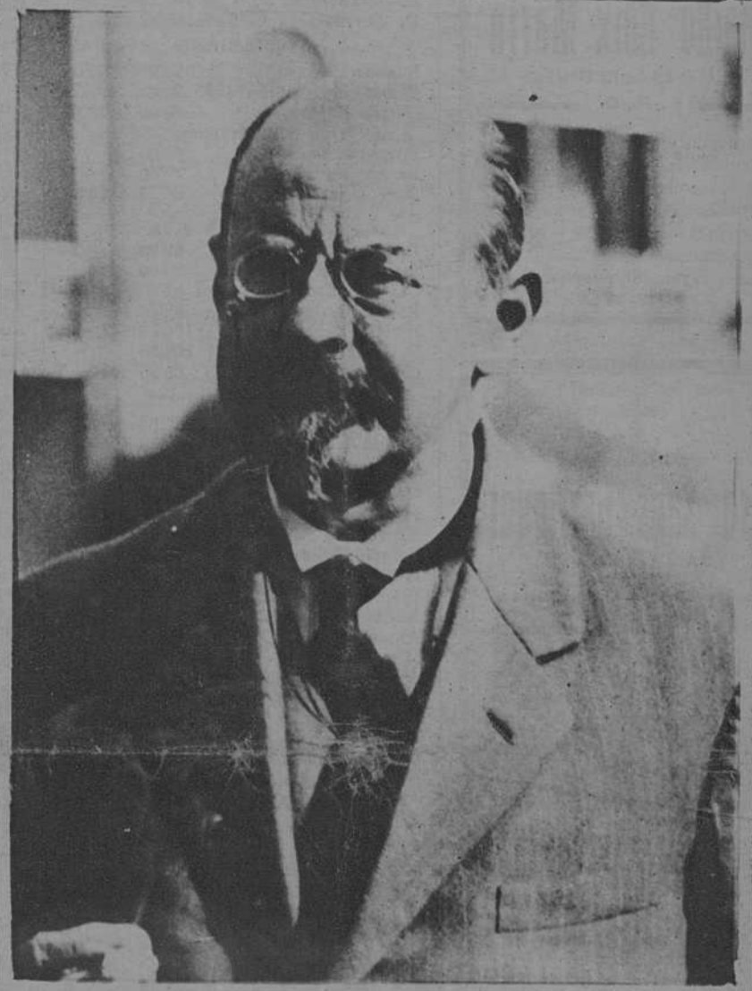
M. Vandervelde, Ministro de Bélgica que ha llegado a París para conferenciar con M. Poincaré, para tratar de la crisis del franco.