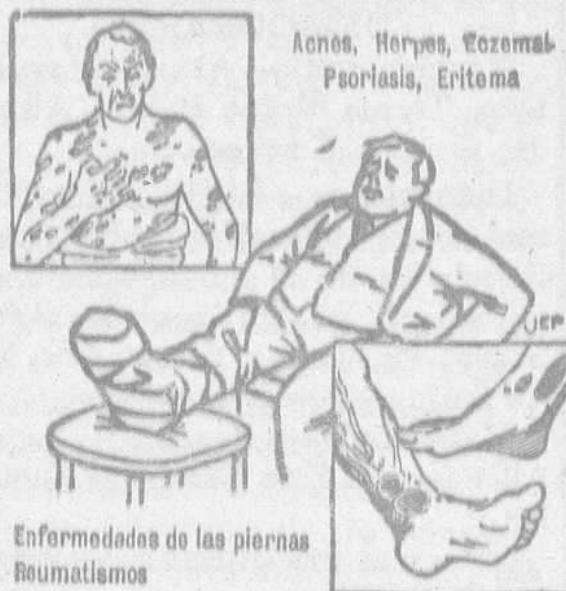
Acnes, Herpes, Eczema, Psoriasis, Eritema

Consignaciones de Buques -- Exportadores de Carbones Fabricantes de Briquetas y Ovoides