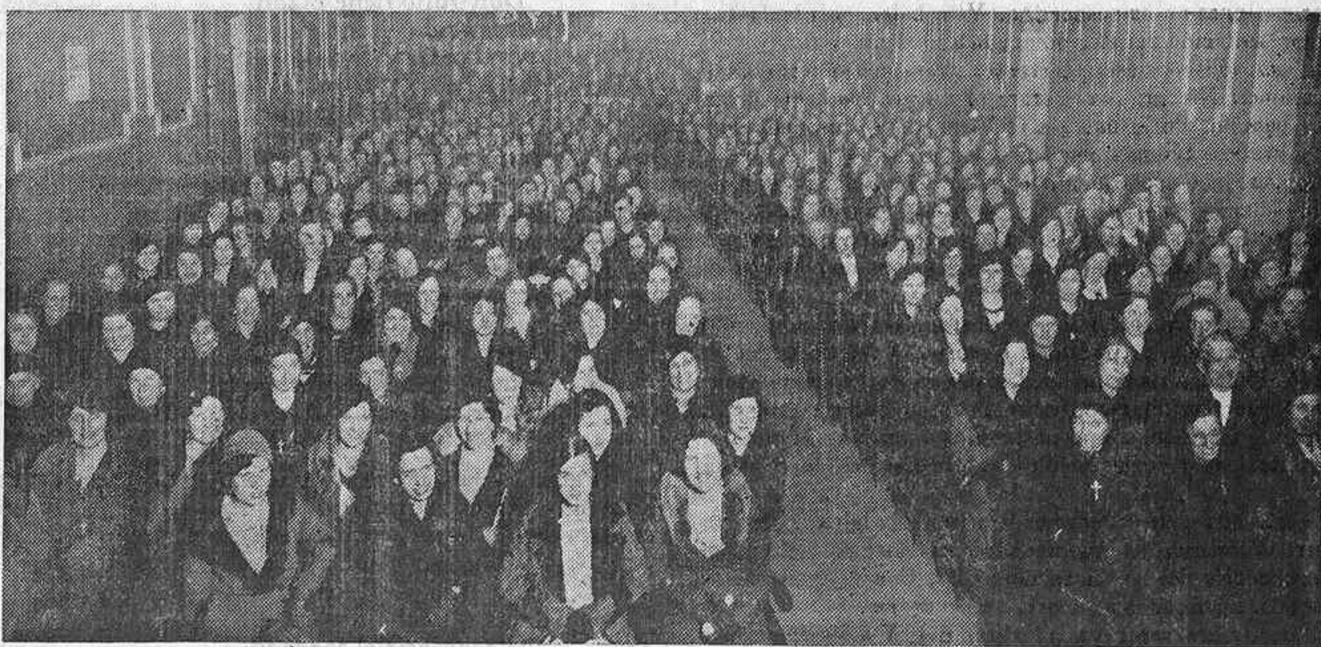
Aspecto del salón en una de las conferencias de Acción Católica de la Mujer, en Gijón.