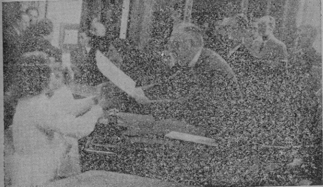
El Alcalde entregando un lote de libros