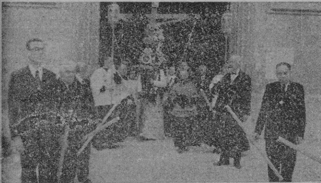
Momento en que la venerada imagen de «La Sangra», sale de la iglesia de la Anunciación