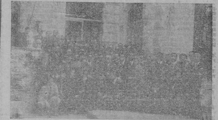
Grupo de asistentes al acto con que la directiva agasajó a los jugadores del equipo por haber conseguido el título de campeón de campeones y el ascenso automático a la II División

El equipo que más se distinguió entre todos, fué el Gosell que se adjudicó el trofeo del Ministro de Marina.—Afil.