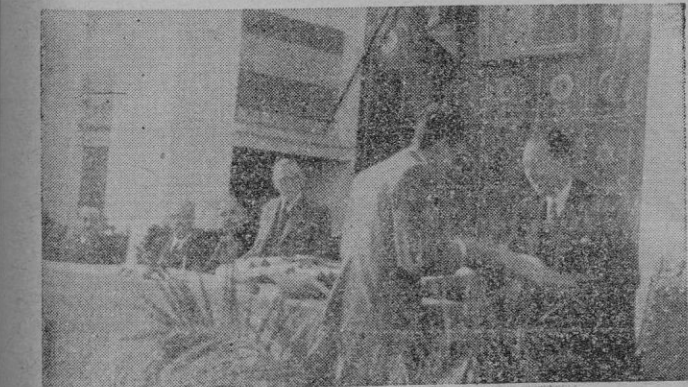
El Presidente de la Diputación en la mesa presidencial del acto celebrado en el Instituto «Ramón Llull», haciendo entrega de su premio a un alumno

Por dicha puerta habrán de entrar los que quieran asociarse a los orantes durante la noche.