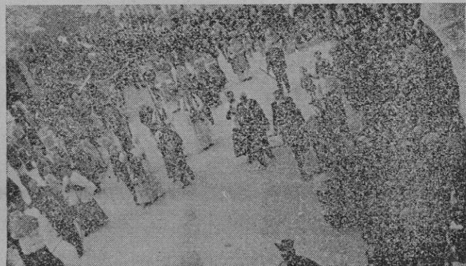
Un aspecto de la brillante procesión celebrada el domingo

Jardín Botánico y Vía Roma ocupando los sitios que les correspondían en la procesión, de cuya organización así como del orden durante el trayecto cuidaron acertadamente jóvenes de Acción Católica y otras asociaciones y congregaciones religiosas.