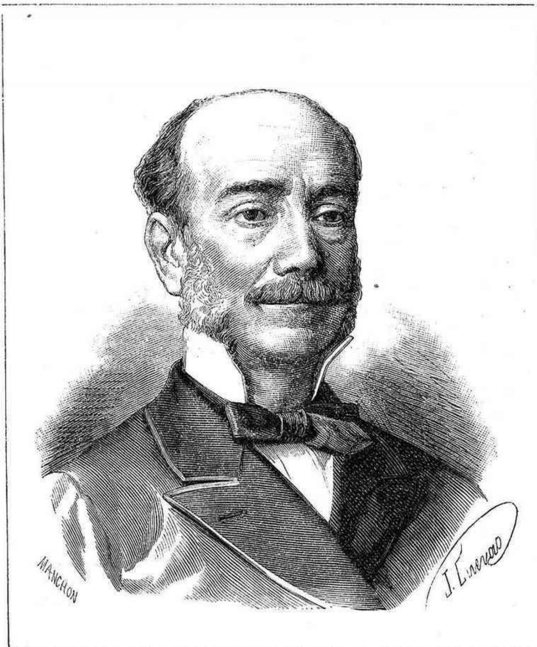
EXCMO. SR. D. CANDIDO NOCEDAL

Lo avisamos aquí á los señores suscritores de la Península en descubierto del pago, no dudando de que corresponderán debidamente á la justa deferencia que con ellos ha tenido la Empresa.