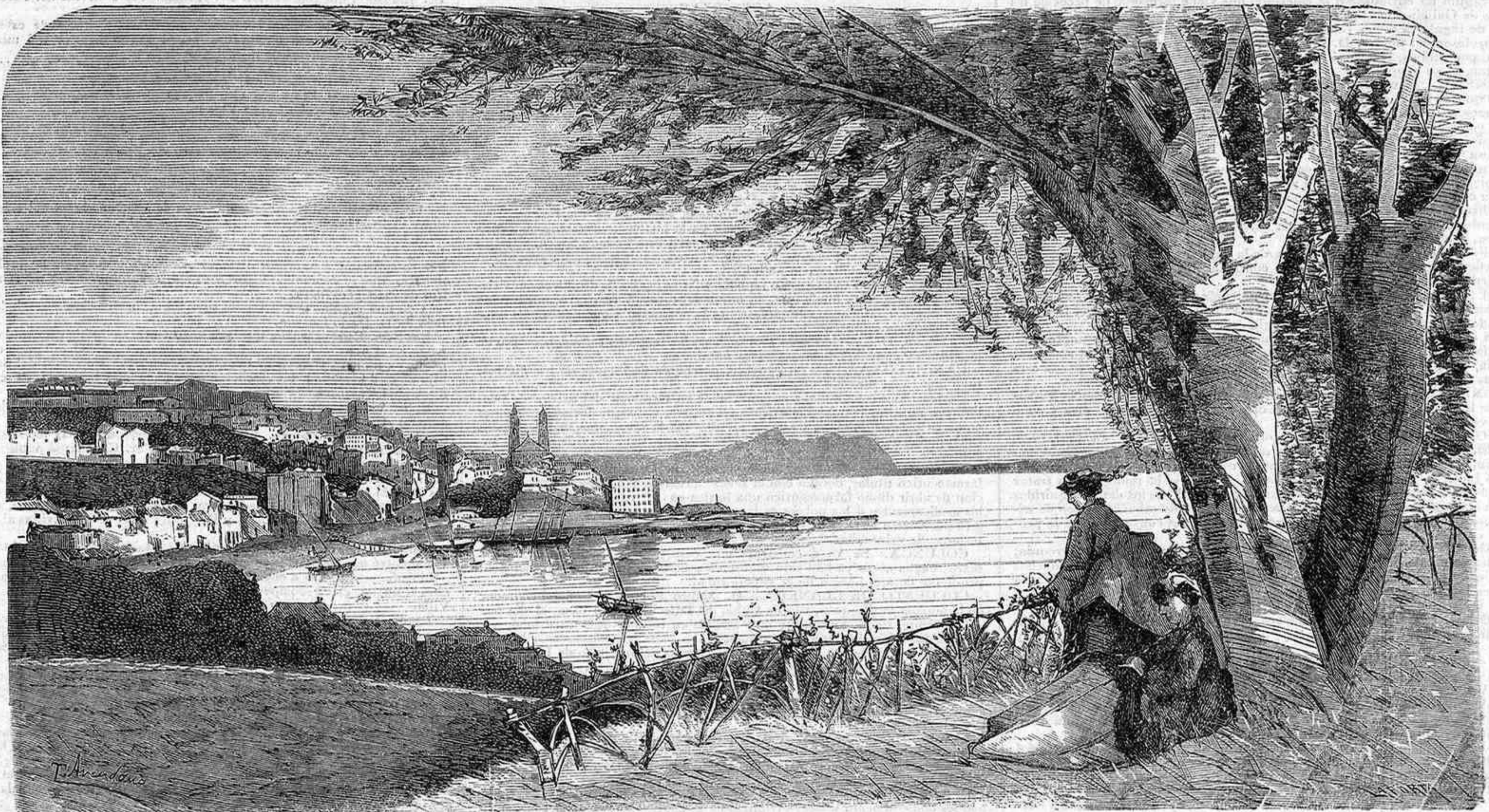
VIGO.—VISTA DE LA CIUDAD, TOMADA DESDE EL CAMINO DE CIRCUNVALACION.