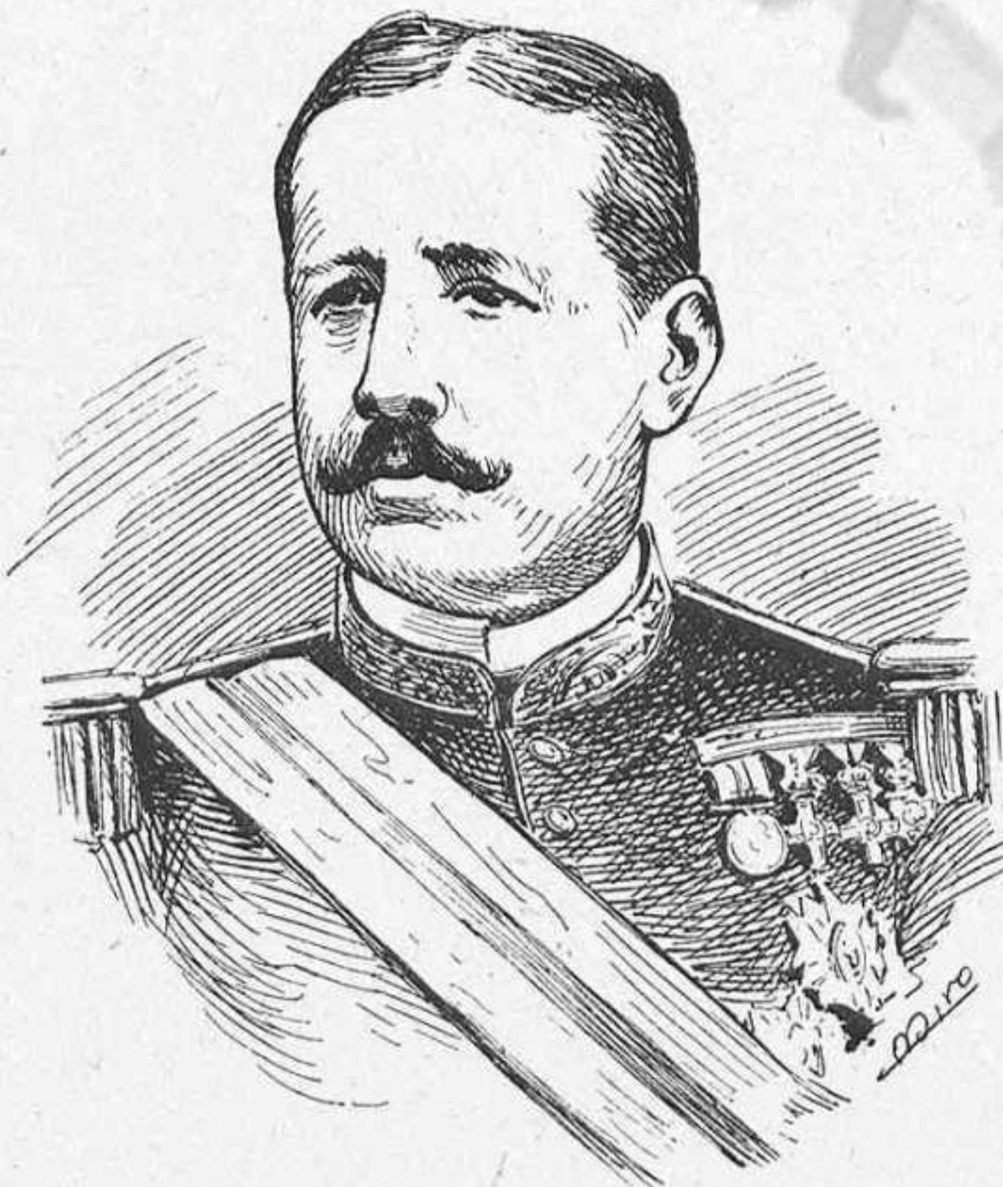
LO GENERAL TEJEIRO.