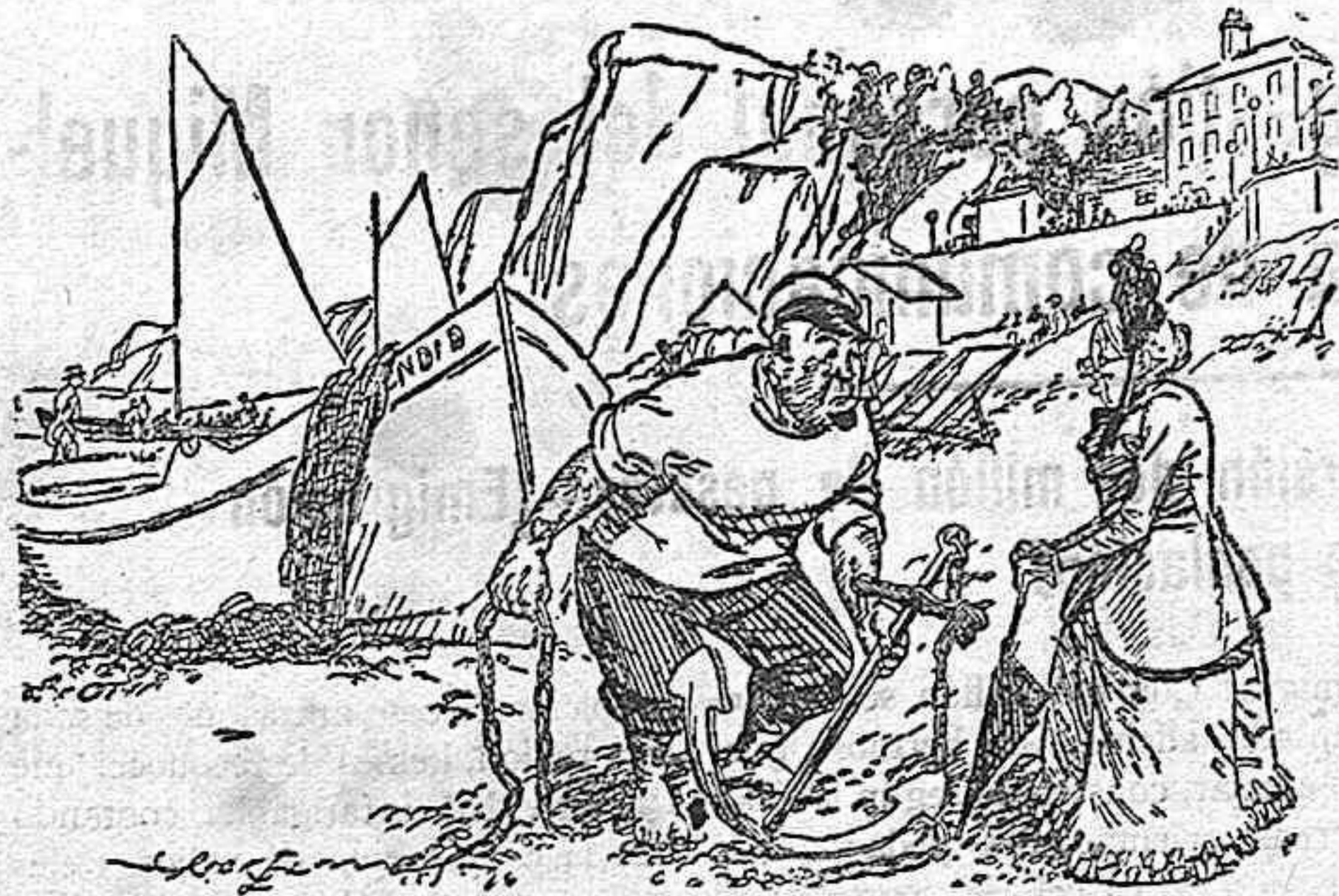
La señora.—¿Y qué clase de peces pescan ustedes con ese anzuelo?