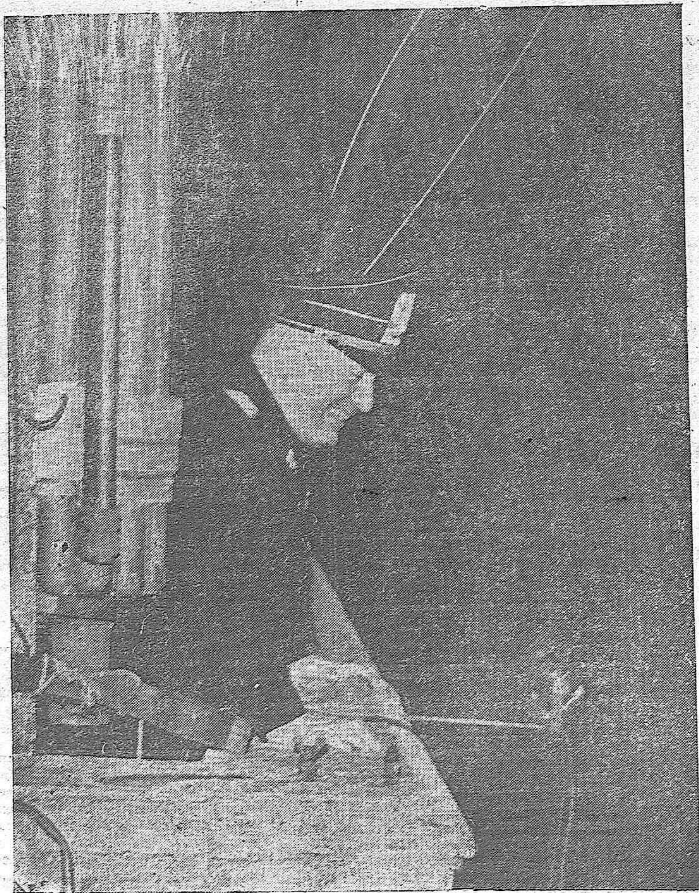
ROMA.—El Duce habla a la multitud reunida en la Plaza de Venecia con ocasión de la ocupación de Barcelona por las tropas del Generalísimo Franco.