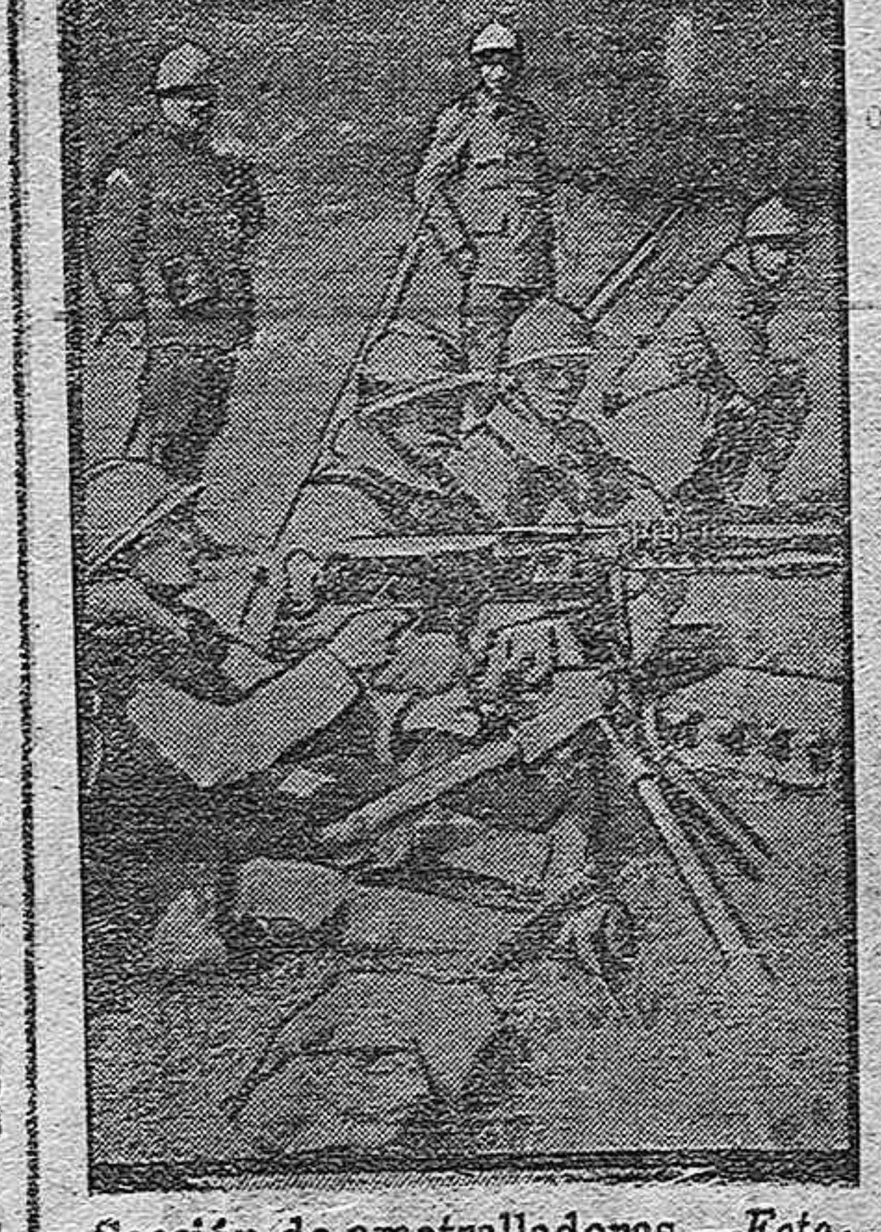
Sección de ametralladoras.