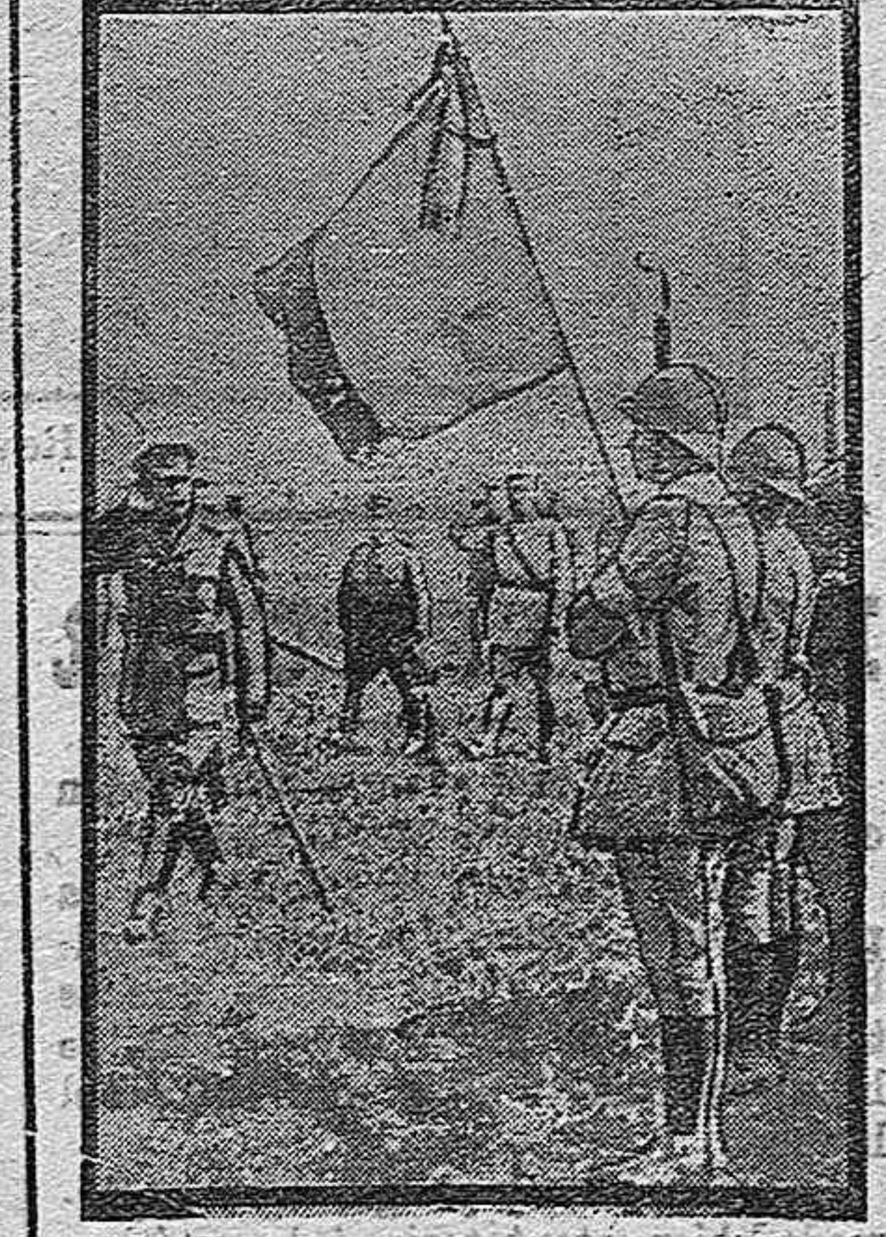
El Mariscal Douglas-Ibaig revistando las tropas francesas.