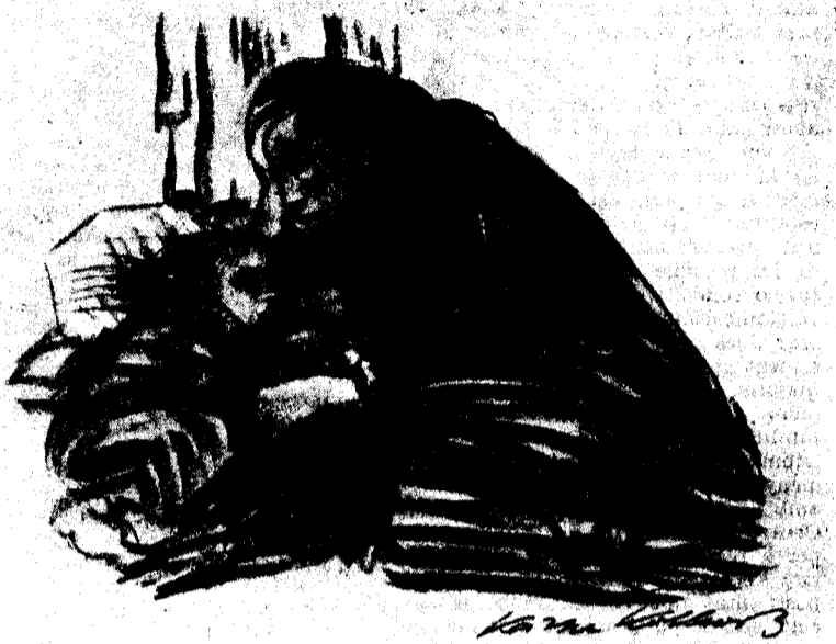
L'ASIL MUNICIPAL, per Käthe Kollwitz