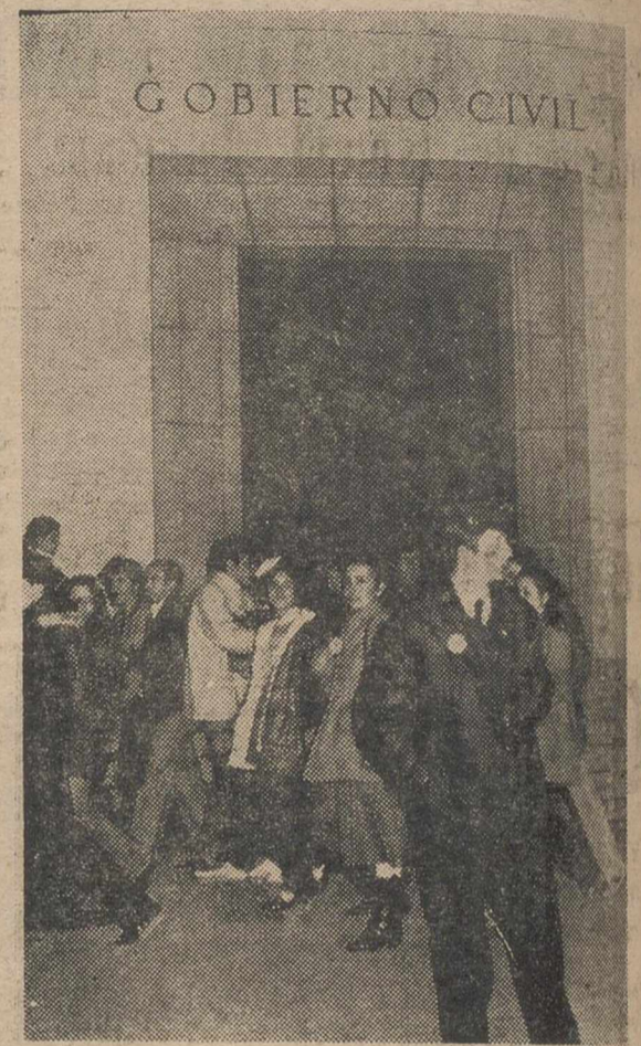
Las fuerzas de orden público no hicieron acto de presencia en la manifestación. Ante el Gobierno Civil, un policía municipal.

Al finalizar el alcalde de la lectura del manifiesto el público asistente irrumpió