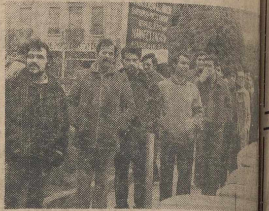
Los trabajadores de la Madera hicieron dos salidas por las calles.

CONTINUA EN LOS CENTROS DE FORMACION PROFESIONAL AGRARIA, TRANSPORTES Y ARTES GRAFICAS