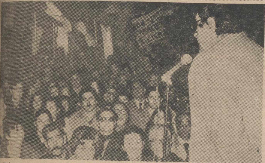
Prácticamente la totalidad de los estudiantes de Bachillerato se sumó a la manifestación. Al finalizar, el alcalde pronunció unas palabras subrayando la demanda de los albacetenses de una Universidad justa. — (Fotos Luis Miguel). — (Pág. 14).