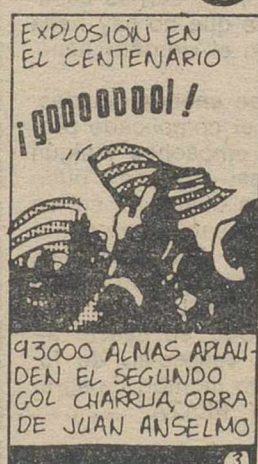
EXPLOSION EN EL CENTENARIO ¡GOOOOOOOO!