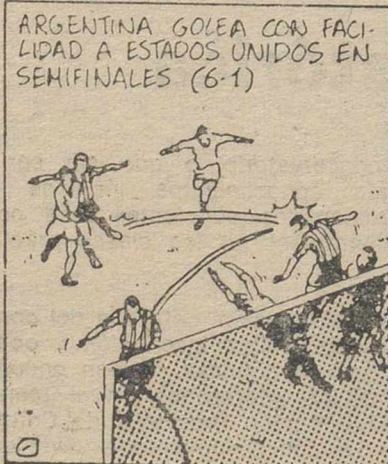
ARGENTINA GOLEA CON FACILIDAD A ESTADOS UNIDOS EN SEMIFINALES (6-1)