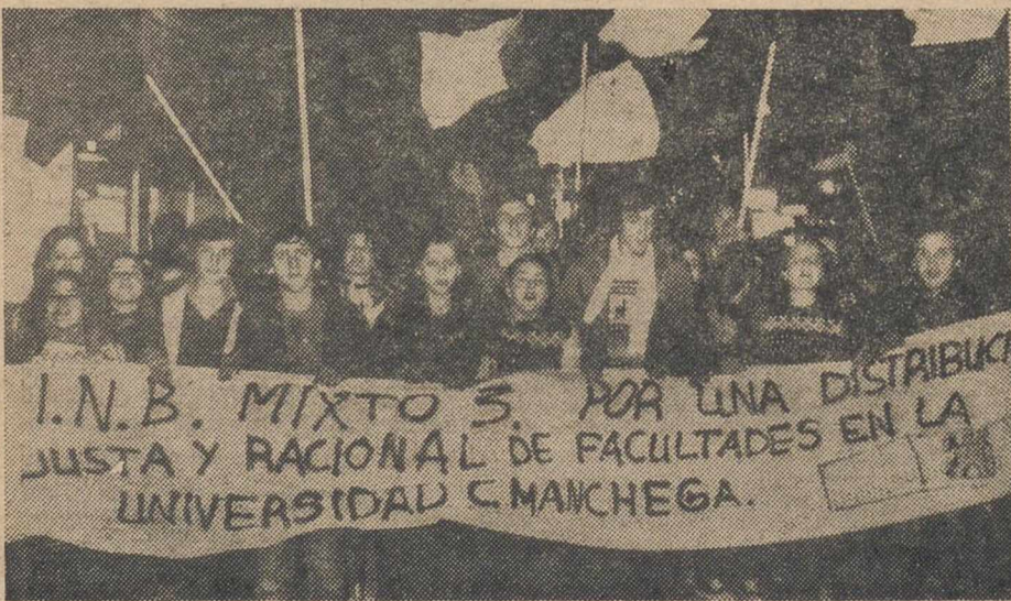
La alegría estudiantil fue una nota destacada.

municipios de Casas Viejas, Tarazona de la Mancha, Villarrobledo, Hoyos Gonzalo, Ayna y Villaverde del Guadalimar sobre instalaciones de portivos, así como para la ejecución de una playeta artificial en La Recueja.