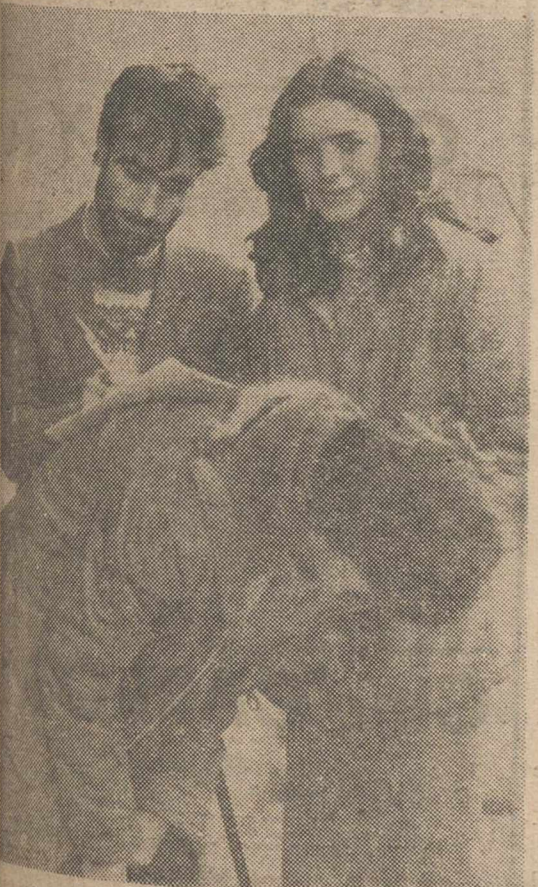
Durante todo el día de ayer, estudiantes de todos los institutos recogieron más de 10.000 firmas de protesta contra el anunciado reparto de facultades universitarias. En la foto, nuestro compañero Avendaño utiliza en plena calle una mesa excepcional para estampar su adhesión, en presencia de una de las encantadoras bellezas que alegraron la jornada. — (Pág. 16)