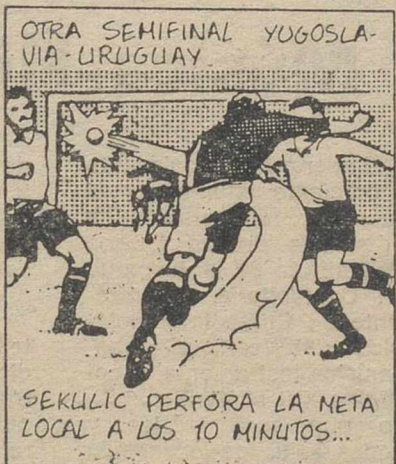
OTRA SEMIFINAL YUGOSLAVIA-URUGUAY