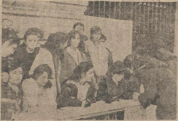
Lindas jovencitas recogieron casi once mil firmas, y no juntaron más porque no quisieron.

Durante el día de ayer los alumnos de Enseñanza Media y Universitaria de Albacete y su provincia hicieron un paro general activo como protesta por la distribución de Facultades de la Universidad de Castilla-Mancha. El paro estudiantil de ayer afectó a todos los centros de enseñanza estatal ya que los centros de la privada no secundaron la huelga.