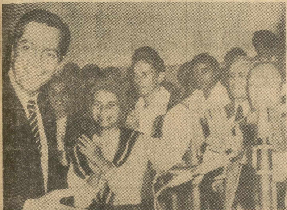
RIO DE JANEIRO. — El presidente del Gobierno, Adolfo Suárez, con miembros de la Colonia Española en Rio de Janeiro. El presidente del Gobierno se encuentra en Brasil en visita oficial.

BRASILIA, 6. (Efe). — El presidente del Gobierno español, Adolfo Suárez, fue recibido este mediodía en el aeropuerto de Brasilia por todos los ministros del Gobierno brasileño al iniciar la etapa oficial de su viaje.