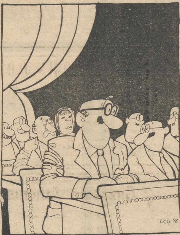
—¿El texto de la Constitución? ¿Antes o después de c. J. C.?