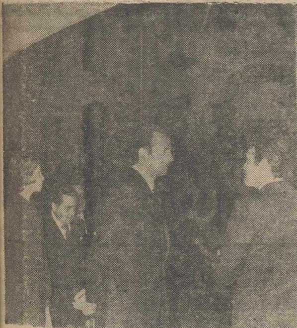
MADRID.—Los Reyes Don Juan Carlos y Doña Sofia, durante su visita a la exposición de cuadros de Rubens, en el Palacio de Velázquez de El Retiro.