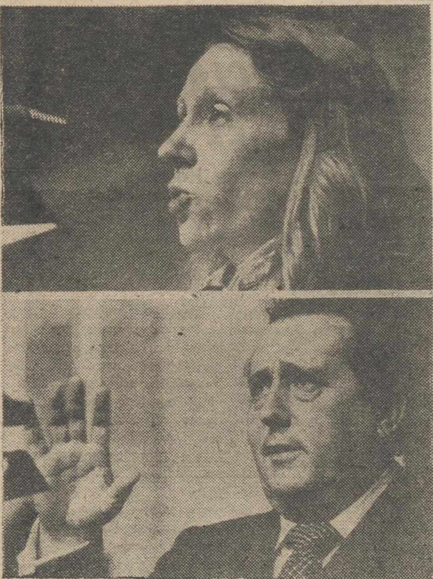
MADRID.—Arriba, la diputada comunista Pilar Bravo, interpela al Gobierno sobre el Consejo Rector de TVE, durante el pleno del Congreso. Abajo, el ministro de Cultura, Pío Cabanillas, responde a la diputada comunista