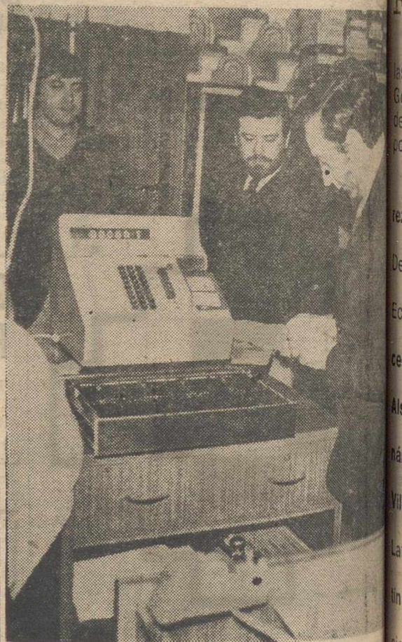
La casa de los pantalones