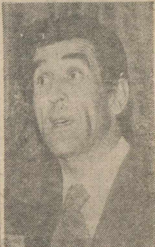
Políticos en activo y otros inactivos, como el ex-ministro Fernando Suárez, confluyen hoy en Albacete en torno a Gómez Picazo. (Información en "El Show de la calle".)

En cuanto a los pactos económicos, el Consejo de Ministros recibió también (Pasa a la CUARTA)