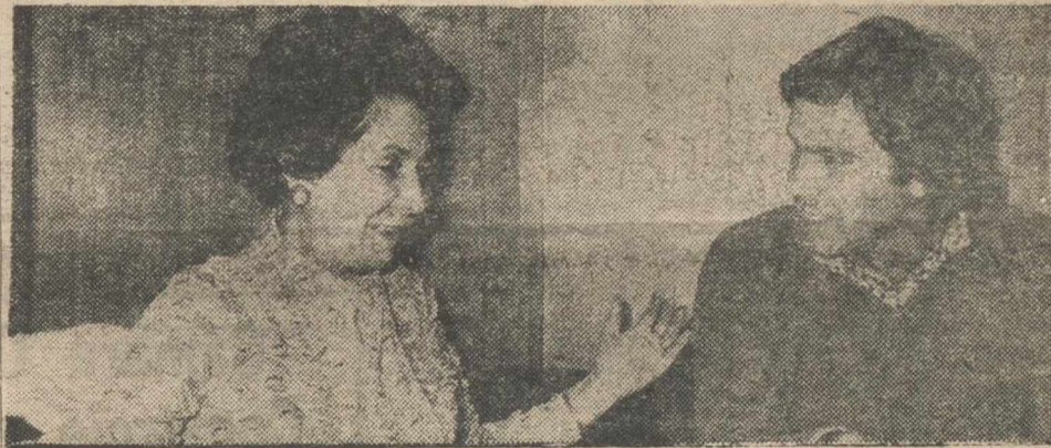
MADRID. — Doña Hortensia Bussi, viuda del presidente chileno, Allende, durante su entrevista con Felipe González, secretario general del PSOE, en la sede de este partido en Madrid.

BARCELONA, 10 (Efe). — Ha llegado esta mañana al aeropuerto de Barcelona, procedente de Madrid, Hortensia Bussi de Allende. Durante su estancia en