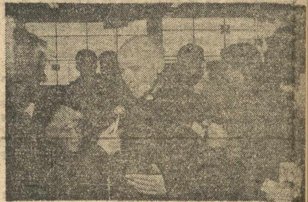
MADRID. — El Padre Arrupe, preposito general de los Jesuitas, a su llegada al aeropuerto de Barajas.