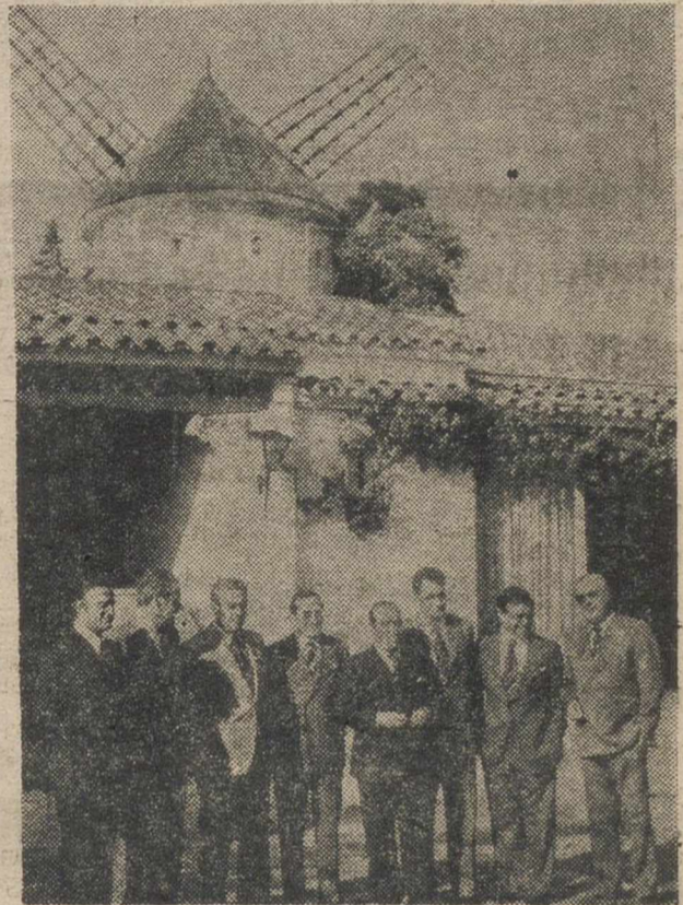
De derecha a izquierda, en la fotografía, Federico Gallo, nuevo gobernador civil de Murcia; Rodolfo Martín Villa, ministro de la Gobernación y Moisés Arrimadas, nuevo gobernador de Albacete, junto con otros gobernadores manchegos y catalanes. La fotografía, tomada en la Semana de la Mancha en Cataluña ---feliz iniciativa de Federico Gallo--- por las casualidades de la política, cobra hoy una simpática actualidad.