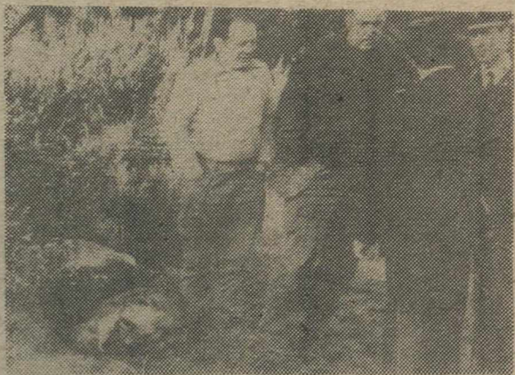
FREJUS.—La Policía investigando cerca de la jaula donde estaban los cuatro leones que hubieron de ser muertos a tiros, en el zoo de Frejus, después de que habían devorado a dos hombres.—.