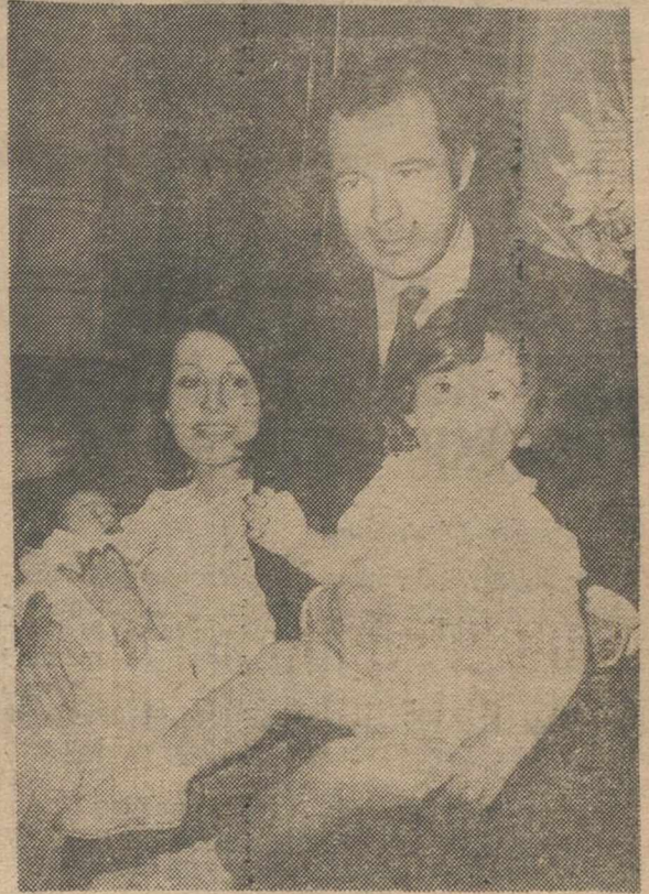
En la foto, los duques de Cádiz, con sus dos hijos, durante la presentación oficial del más pequeño. (Foto CIFRA GRAFICA).