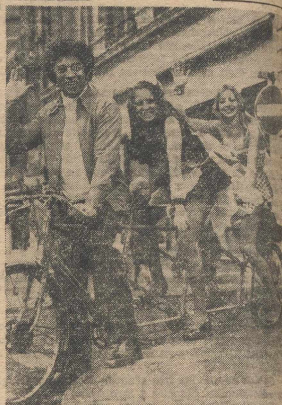
El famoso cantante canadiense, Bobby G. Griffith, está realizando su primera visita profesional a Inglaterra. Estos días actúa en el cabaret del Penthouse Club de Londres. Deseoso de conocer la ciudad y dada la crisis de energía, decidió recorrer sus calles con una bicicleta. Como guías se buscó a dos guapas camareras del club donde actúa y con ellas, en una bicicleta para tres, se lanzó a las calles de la capital inglesa. (FOTO FIEL).