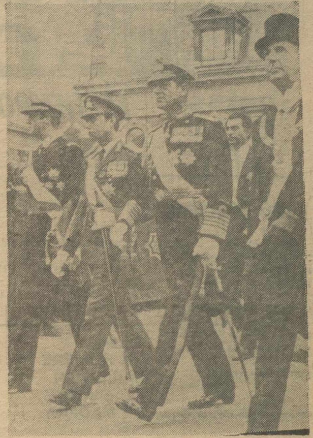
ESTOCOLMO.—El Príncipe de España, acompañado del gran duque de Luxemburgo, del duque de Edimburgo, esposo de la reina Isabel de Inglaterra, y del ex-rey Humberto de Italia, de izquierda a derecha, que formaron en el cortejo de personalidades asistentes a las exequias fúnebres por el alma del rey Gustavo Adolfo de Suecia.