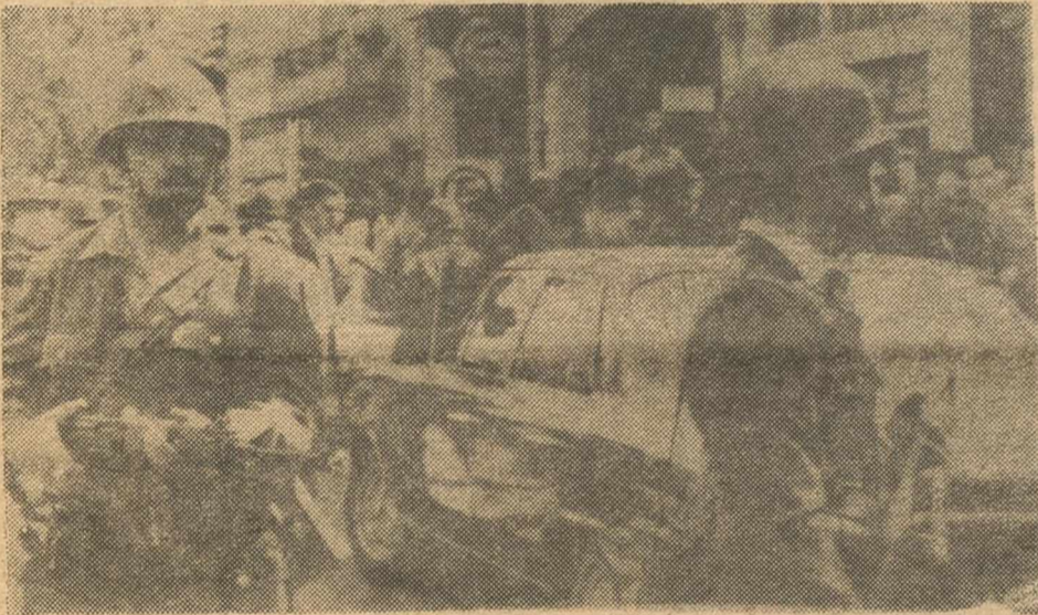
BUENOS AIRES.—Fuerzas de la Policía rodean el coche en el que fue muerto el dirigente de los sindicatos peronistas, José Rucci.

Todas las actividades están paralizadas y el Gobierno anuncia que no habrá contemplaciones con los asesinos