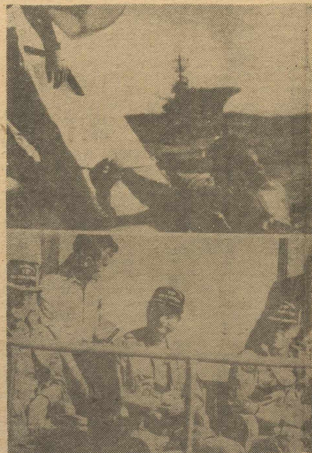
FOTO COMPOSICION.—Arriba, los nombres suya, trabajando junto a la cápsula Apolo, para ayudar en su salida a los tres astronautas. Al fondo el portaviones “Nueva Orleans”. Abajo: Los tres astronautas, Jack Lousma, Owen Garritor y Alan Bean, en una plataforma móvil, donde fueron transportados hasta los laboratorios móviles de la operación “Skylab”, para ser examinados. Permanecieron 59 días en el espacio.