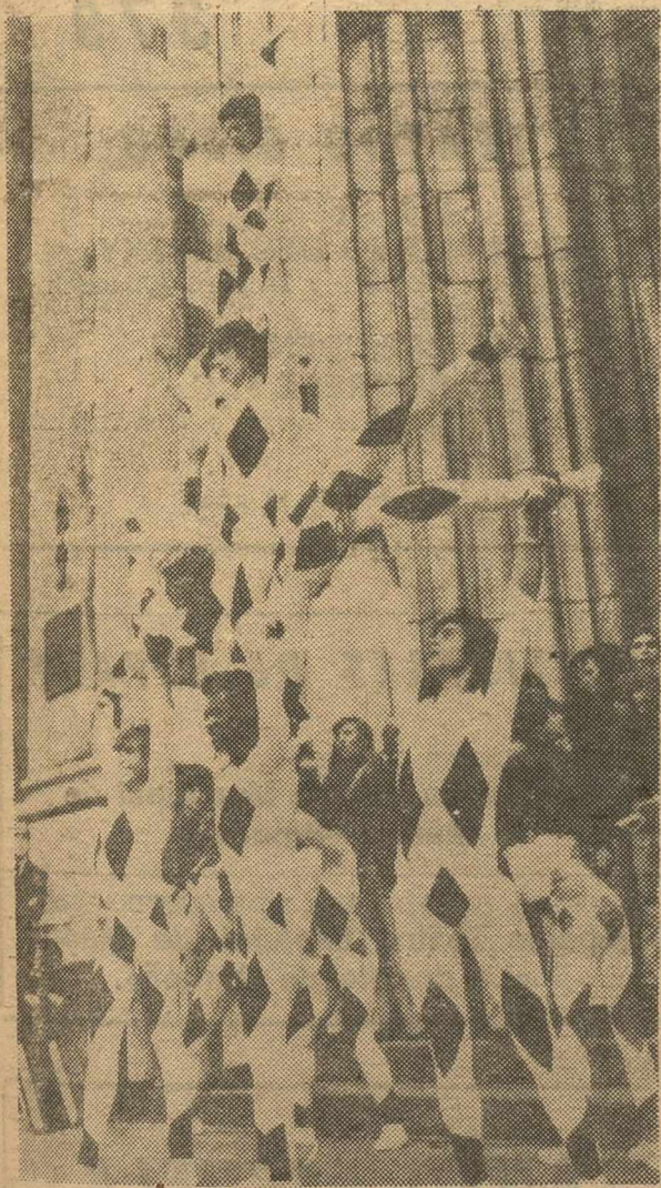
NUEVA YORK.—Miembros del circo español de "La ciudad de los muchachos" hacen una torre humana delante de la iglesia de San Patricio.