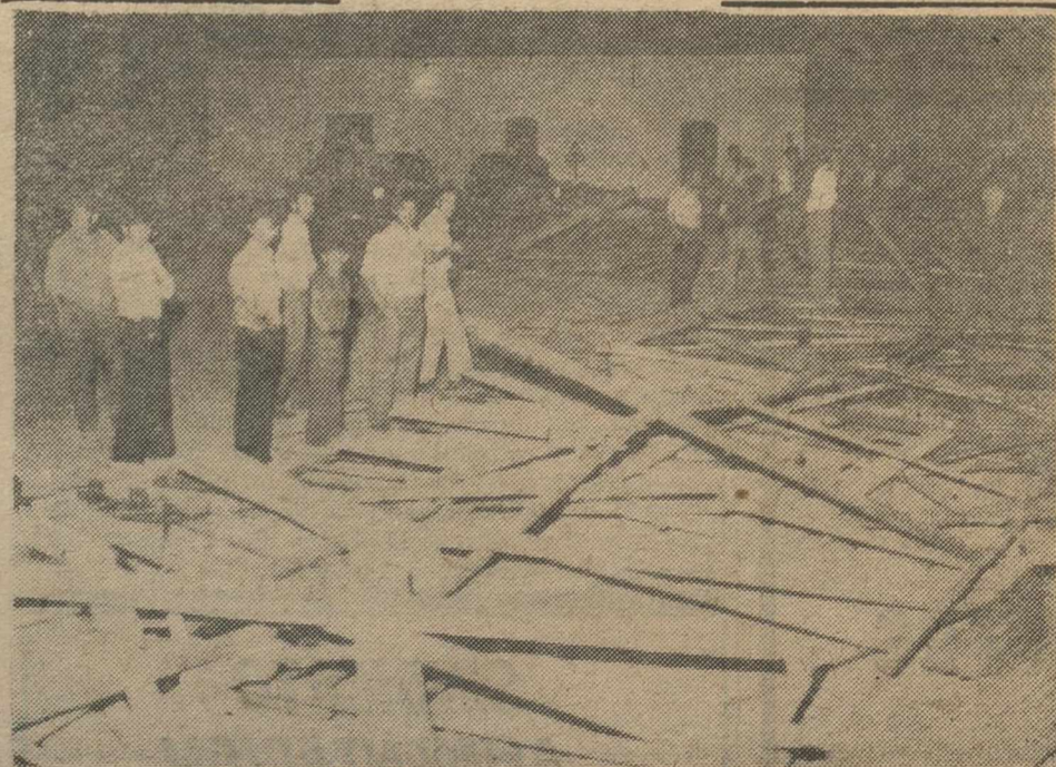
FRESNO EL VIEJO (Valladolid).—Durante la lidia del segundo de los cuatro novillos que debían lidiarse, se produjo el hundimiento, por causa que se ignoran, la plaza de toros portátil instalada en esta localidad. Ha habido que lamentar un muerto y numerosos heridos, cinco de ellos de pronóstico gravísimo. En la foto, una vista del lugar del siniestro.