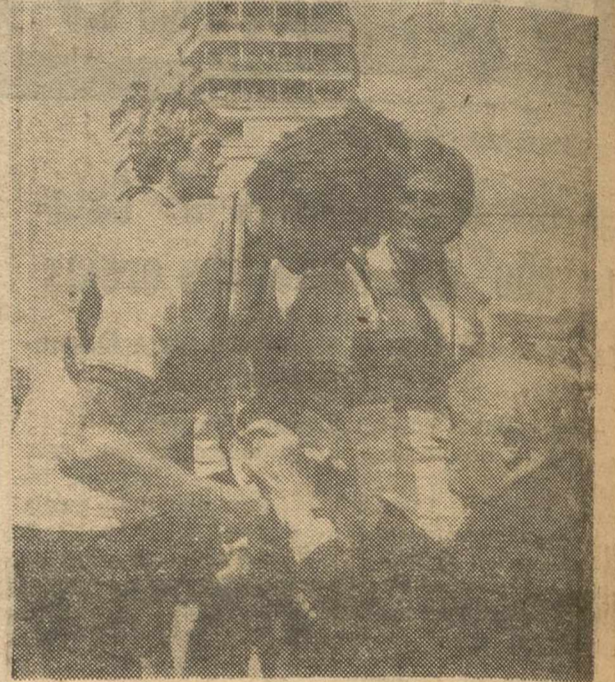
GRANOLLERS.—El presidente de la UCI entrega a los componentes del equipo polaco amateur de ciclismo la medalla de oro como primer clasificado.