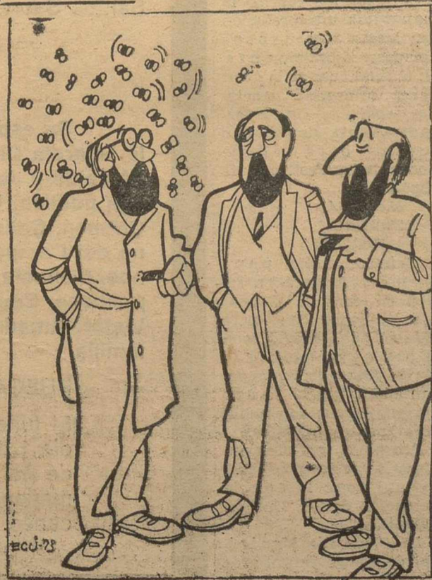
Me tienen Vds. muy mosqueado.