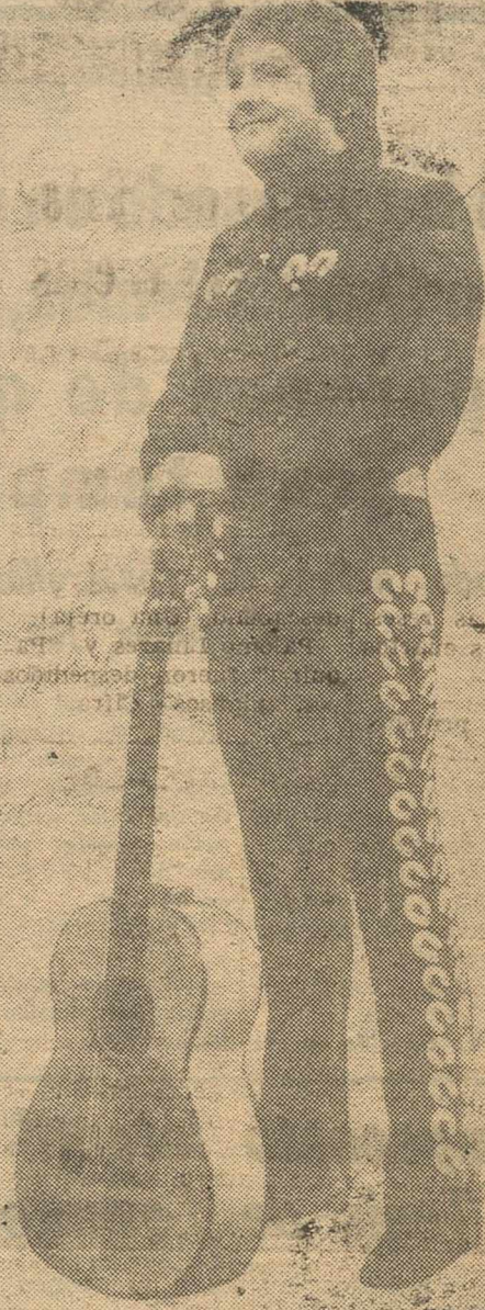
Mañana, sábado, a la una y media de la ma-

El famoso cantante mejicano debuta en Albacete después de triunfar en Madrid