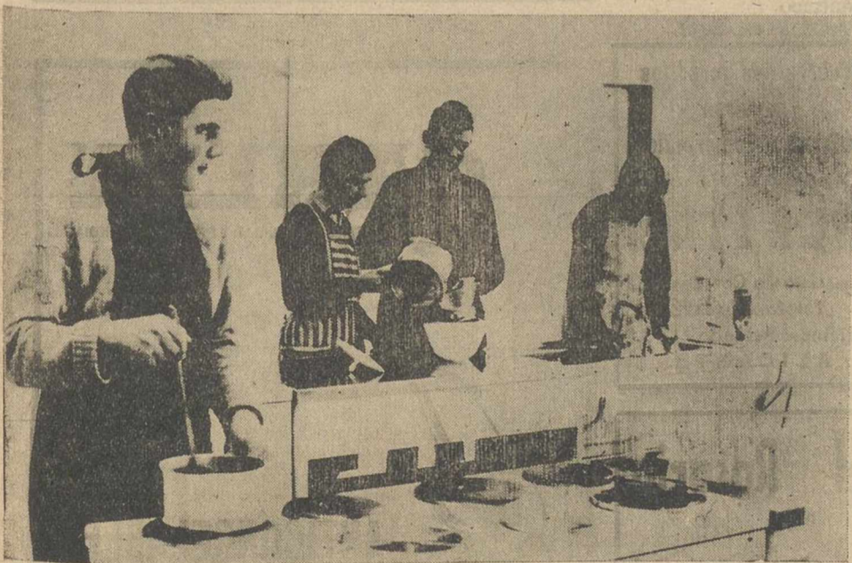
Los escolares masculinos de la comuna de Aarberg (Suiza), preparan unos buenos platos en la cocina "tradicional" de la escuela. Ante el éxito obtenido el año pasado la comuna ha organizado un nuevo curso culinario este año con gran satisfacción por parte de los alumnos y, por supuesto de sus madres.