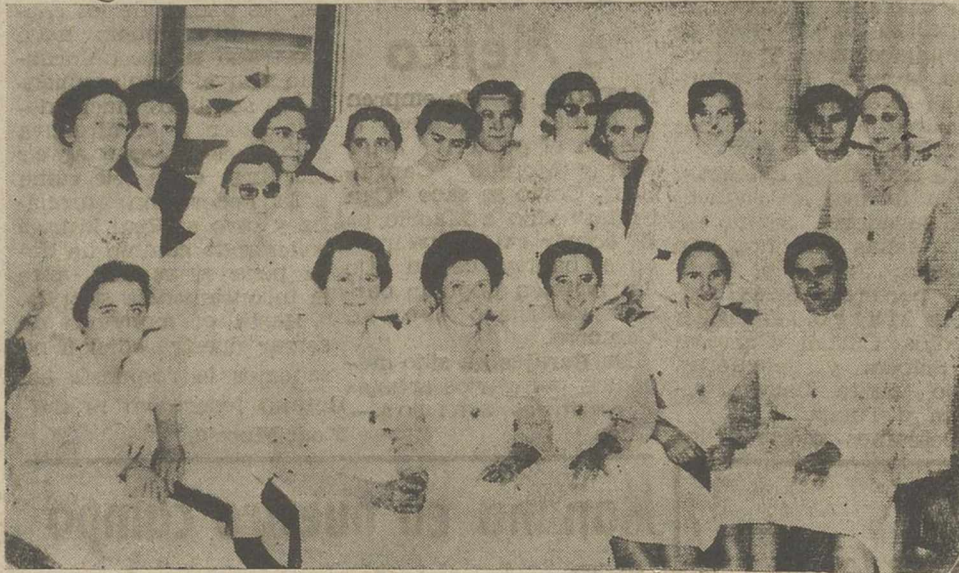
mamente, la Escuela de Enfermeras inaugurada recientemente.

La noticia ha causado gran satisfacción en Albacete donde la Obra cuenta con dos comunidades en la capital y una en Valdeganga