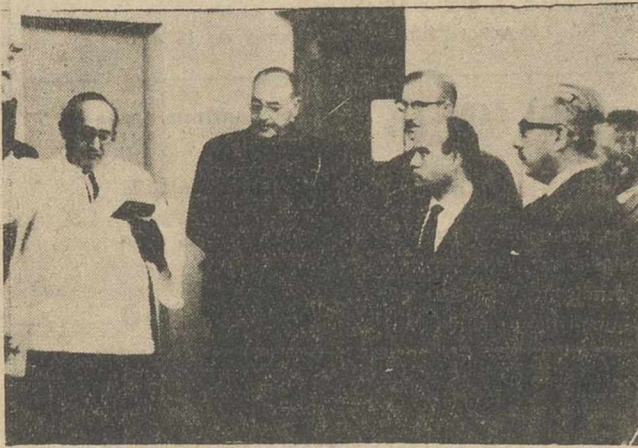
El Excmo. señor gobernador civil y jefe provincial del Movimiento, don Miguel Cruz Hernández, visito, en la tarde de ayer, la localidad de Balazote, donde inauguro importantes obras por un valor to-

Presidió los actos el gobernador civil y jefe provincial del Movimiento