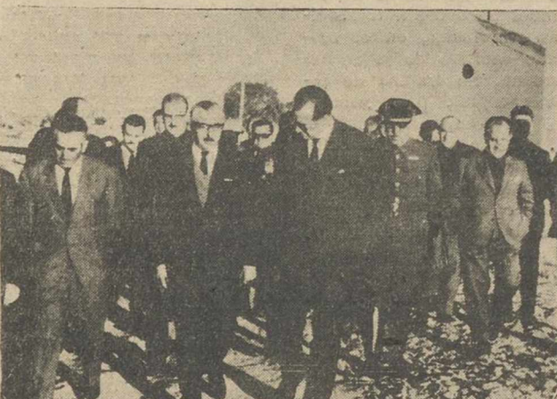
tal de cerca de tres millones de pesetas, siendo objeto de vivas demostraciones de adhesión y simpatía por parte de aquel vecindario.