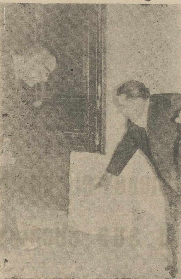
El escultor autodidacta muestra a nuestro compañero el último blasón que ha realizado.

Se ha especializado en blasones nobiliarios