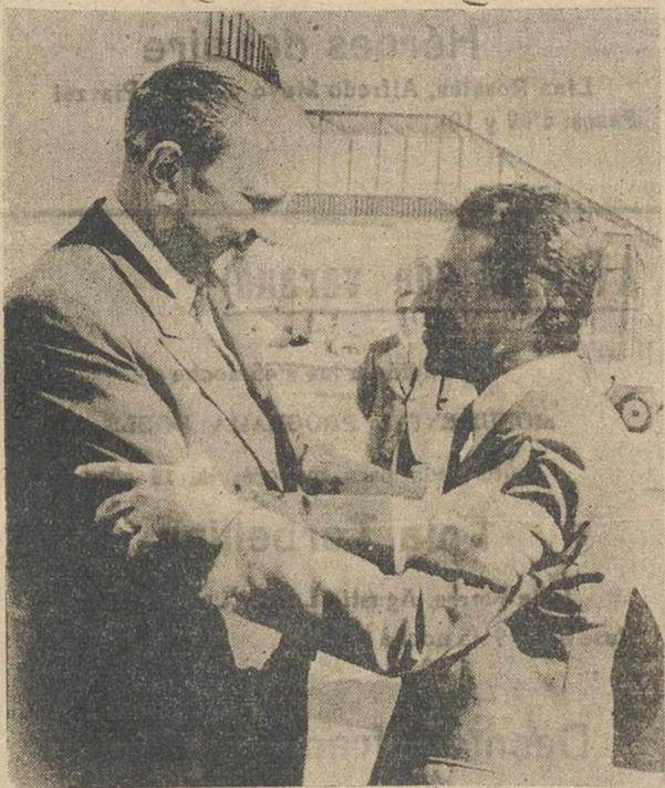
El ministro marroquí de Asuntos Exteriores