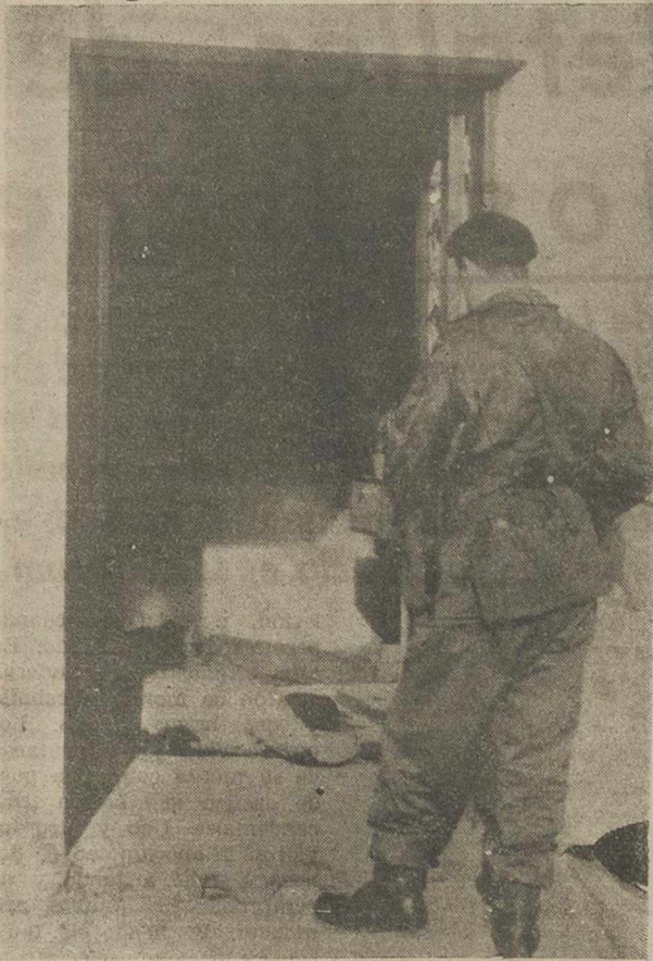
Un comando inglés contempla desde el umbral de la puerta de una vivienda de la aldea turco-chipriota de Ayio-Sozomenos, a 14 millas de Nicosia, los cadáveres de dos turco-chipriotas que junto con 5 más fueron muertos en un tiroteo contra combatientes irregulares greco-chipriotas. A la llegada de los soldados ingleses, y bajo su protección, los 180 habitantes de la aldea fueron evacuados precipitadamente, con sus enseres y su ganado hacia una aldea turco-chipriota situada a 5 millas.