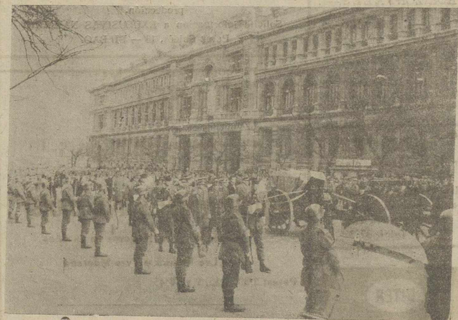
En Madrid ha tenido lugar el entierro de los restos mortales del hasta ahora ministro del Ejército, teniente general don Pablo Martín Alonso. El féretro era conducido sobre un armón de Artillería. Presidieron el duelo el vicepresidente del Gobierno, capitán general Muñoz Grandes, y el hijo del finado. En la foto, las fuerzas presentan armas al paso del cortejo por la calle de Alcalá.