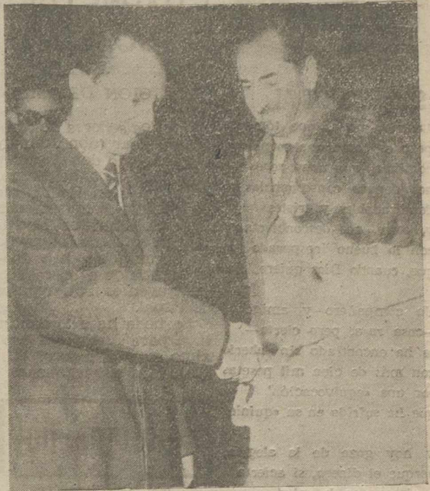
A su regreso de La Haya, donde se han confirmado sus próximos esponsales con la princesa Irene de Holanda, don Carlos Hugo de Borbón y Parma, es saludado en el aeropuerto de Barajas por varios amigos que acudieron a recibirle.