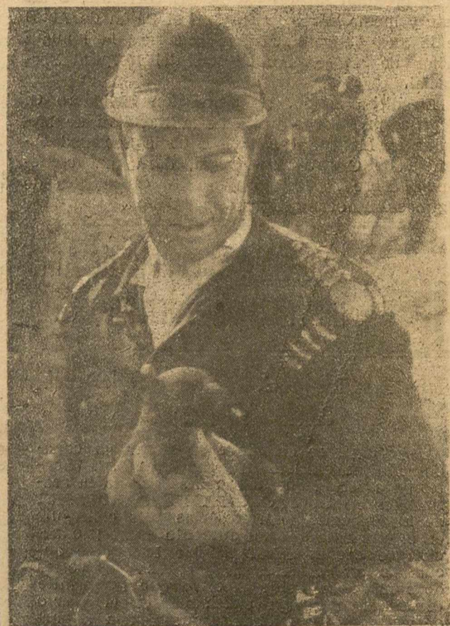
NOTA EMOTIVA.—Por fortuna en el suceso de esta mañana no se registraron desgracias personales y hasta un pequeño perro fue salvado de entre las ruinas de la casa hundida y le vemos aquí en brazos de uno de los bomberos que intervinieron en los trabajos de salvamento.

No creamos que sea necesario insistir nuevamente en las razones que motivaron nuestra demanda, que tan grata acogida ha tenido por parte del señor alcalde. Fue el propio señor Gómez-Rengel quien, con más elocuencia que nosotros podríamos hacerlo, rindió, al presentar su propuesta, un cálido homenaje de elogio y justicia al ilustre doctor desaparecido y, a hora, sólo nos resta expresar nuestra satisfacción íntima por el acuerdo que, estamos seguros, comparten infinidad de albacetenses, al ver cómo también en esta vida, saben los hombres premiar, las rectas conductas, las vidas ejemplares, que pueden servirnos de norma, modelo y ejemplo a todos los que integramos la gran comunidad puesta por Dios sobre esta tierra seca de la Mancha, donde a falta de otros dones de la naturaleza, florecen las mejores virtudes, como en el caso concreto que comentamos, para orgullo de todos.