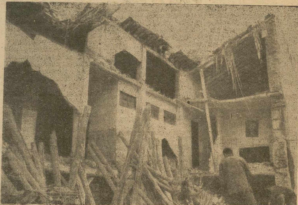
Estado en que quedó la casa hundida esta mañana en la calle de Antonio Rentero