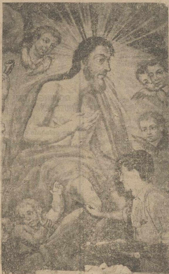
Valero, el joven pintor albacetense, con una de las pinturas de la cúpula que más ha necesitado de su intervención.

—Después de su previo reconocimiento, se procedió a