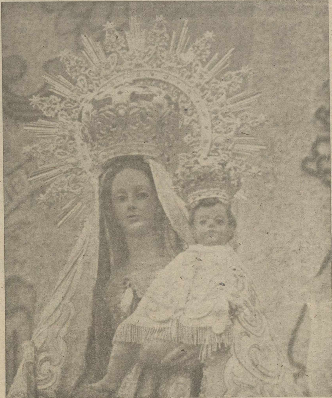
En los últimos días de mayo y como ya se informó en esta página, la ciudad de Hellín, ha rendido fervorosos homenajes a su venerada Patrona la Santísima Virgen del Rosario, con motivo de cumplirse el primer aniversario de su inolvidable Coronación Canónica.

Mañana día 10 de junio "Día de la Caridad"