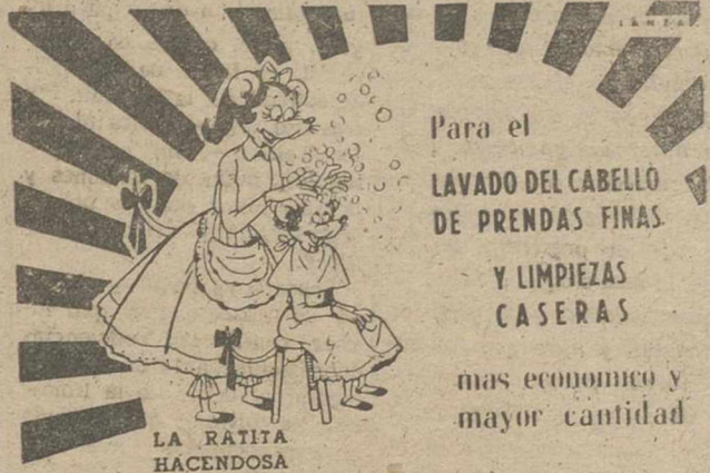
LA RATITA HACENDOSA