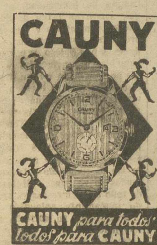
CAUNY para todos todos para CAUNY

Participe usted en nuestro concurso donde podrá ganar UN PRIMER PREMIO de 25.000 PESETAS o uno de los DIEZ SEGUNDOS premios de 1.000 PESETAS cada uno, o uno de los TREINTA TERCEROS premios de 500 pesetas cada uno.