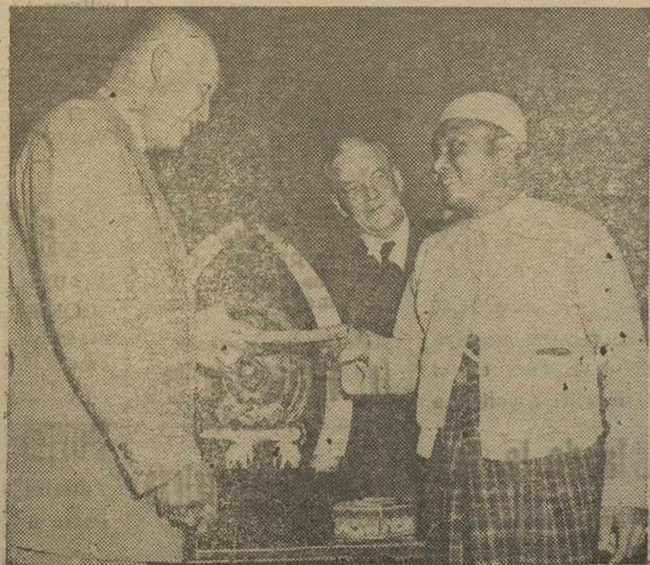
En el centro aparece el secretario de Estado, John Foster Dulles.

MD 10.— El Presidente Eisenhower recibe en su despacho de Washington, de manos del primer ministro de Burma, U Nu, un cheque de 5.000 dólares (unas 200.000 pesetas) con destino a un homenaje en honor de los soldados americanos que murieron en su país durante la última guerra. Así mismo recibió un regalo consistente en un artefacto de mesa, de llamante labrado en plata y marfil.