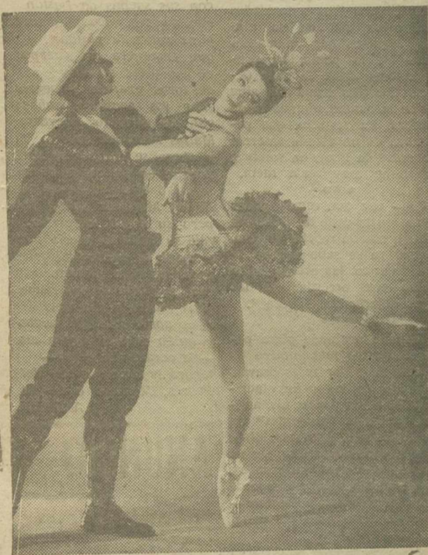
Nicolás Magallanes y Diana Adams, miembros de la Compañía de Opera de Nueva York, en una escena de la "Sinfonía del Oeste". Esta compañía en el mundo, ha recorrido triunfalmente las principales ciudades de Europa y América.