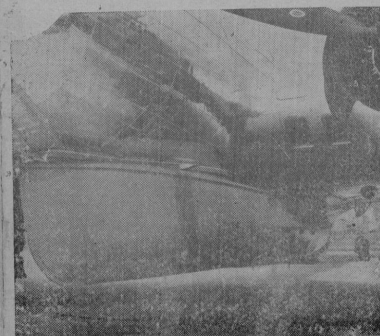
Bajo el fuselaje de la Fortaleza Volante B-17, va un bote salvavidas de reciente creación que puede lanzarse para salvamentos en el mar

Gravillas y machacas de la cantina "Sa garriga rasa" Despacho. Sto. Cristo, 14 Entlo. Tel. 100