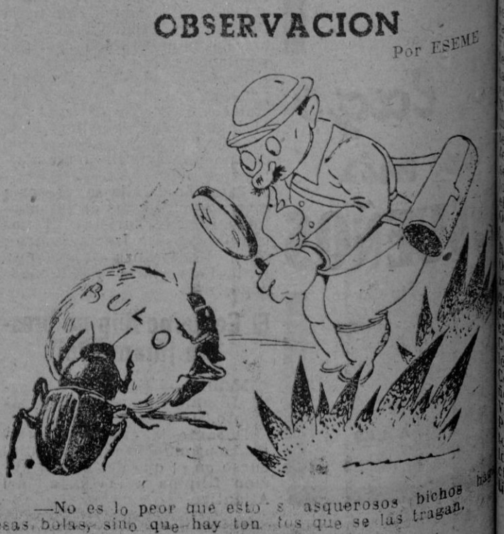
—No es lo peor que estos asquerosos bichos esas bolas, sino que hay tonos que se las tragan.

Las fuerzas blindadas han hecho 3 mil prisioneros, entre ellos un general de división y su Estado Mayor.