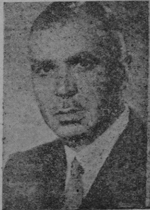
D. Miguel Mateu, nuevo Embajador

Berna.— Comentando la cues- tión de la crisis belga, "La Tri- bute de Gêneve" dice que la crisis actual no es, nada más que la señal de crisis más impor- tante que habrán de producirse seguramente en todos los países liberados como consecuencia de las divergencias entre los Go- biernos exilados y los grupos de