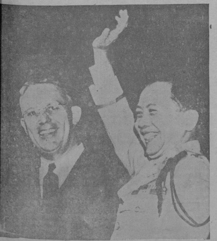
El Coronel Carlos P. Romulo (derecha) Secretario de Información y Relaciones Públicas de Filipinas, saluda a los delegados de la asamblea republicana en Chicago

La fuerza de las armas no puede crear situaciones estables sino en cuanto sirvan para abrir paso a condiciones de vida enteramente de acuerdo con el derecho y la justicia. (De las declaraciones del Caudillo a la "United Press")