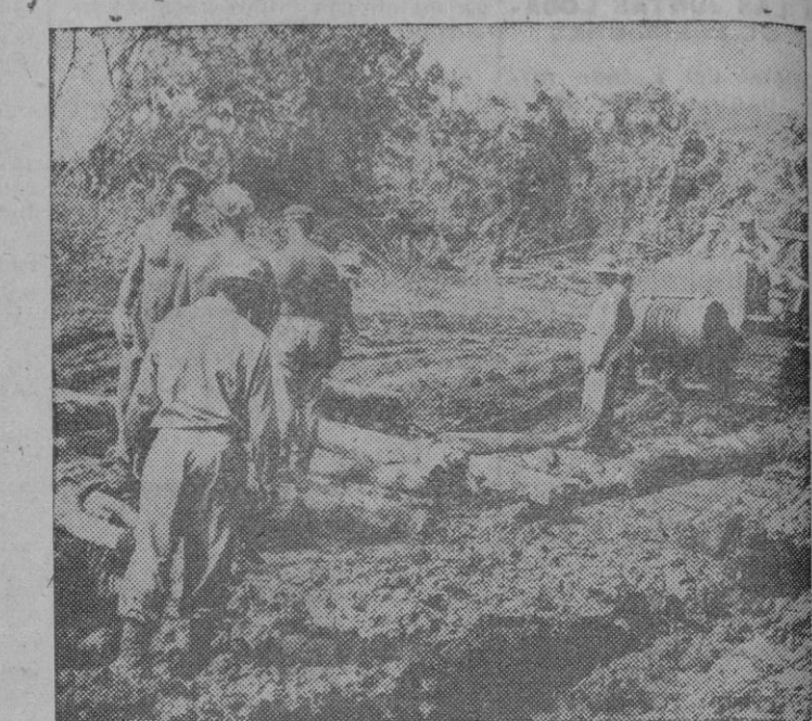
Ingenieros del Ejército americano emplean el torno de una niveladora para arrastrar los troncos que han de servir de firme en una zona fangosa de Nueva Bretaña