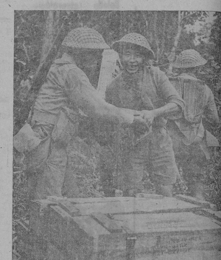
Soldados chinos amontonando cajas de munición en un depósito de la jungla en el Valle de Mogaung, norte de Birmania