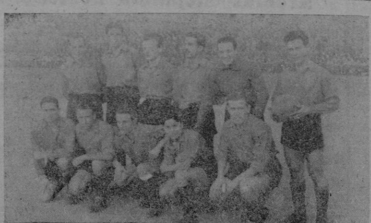
El once del Mallorca que venció al A-Baleares y se ha proclamado campeón del IV Grupo de la III División

Se hace público para general conocimiento, rectificando la nota inscrita en la prensa local del reparto de la presente semana que el precio de la ración infantil del arroz, es el de 0'45 pesetas y no 0'50 como en aquella se indica. Palma de Mallorca 31 Enero de 1944. — El Gobernador Civil