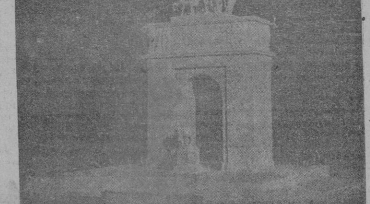
Maqueta del Arco de Triunfo dedicado a S. E. el Jefe del Estado, Caudillo de la cultura española, restaurador de la Ciudad Universitaria