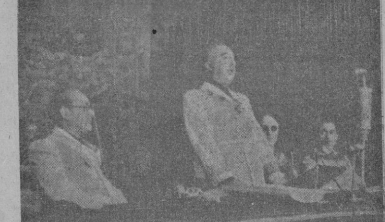
S. E. el Jefe del Estado pronunciando su importante discurso en la Ciudad Universitaria