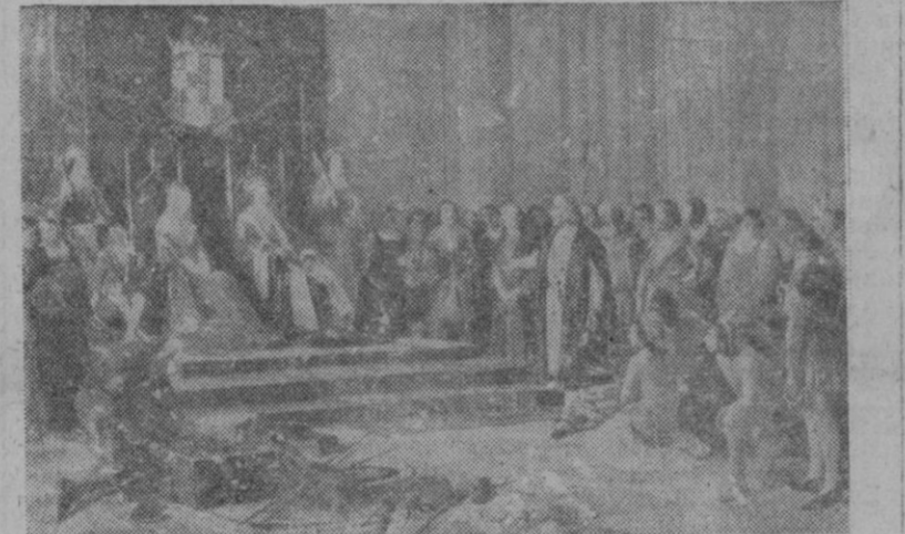
Barcelona. — Los Reyes Católicos, en el Palacio Real (hoy exconvento de Santa Clara), en el acto de recibir al Gran Almirante Cristóbal Colón, quien les explicó su gloriosa hazaña

Al final del banquete al que asistieron 350 comensales, el Presidente de la Diputación pronunció el siguiente brindis: "En nombre de la provincia de Barcelona, que siente como un sentir de España, brindo por la prosperidad de todas las naciones aquí representadas tan dignamente, para que, en un día el alma de la Hispanidad pueda decir su gran palabra de amor." El Nuncio de Su Santidad, en representación del Cuerpo diplomático contestó con las siguientes palabras: "En nombre del Cuerpo diplomático, del que soy decano, doy gracias por la salutación tan cordial que el Presidente de la Diputación ha dirigido a las naciones representadas en este acto y que son al mismo tiempo expresión de los pueblos de Hispanidad. Deseamos asimismo que todos los problemas que preocupan a la ilustre corporación provincial, puedan tener realización completa para el bien de Barcelona, su provincia y España. Acabó brindando por la prosperidad del Presidente del Consejo de la Hispanidad y del Caudillo."