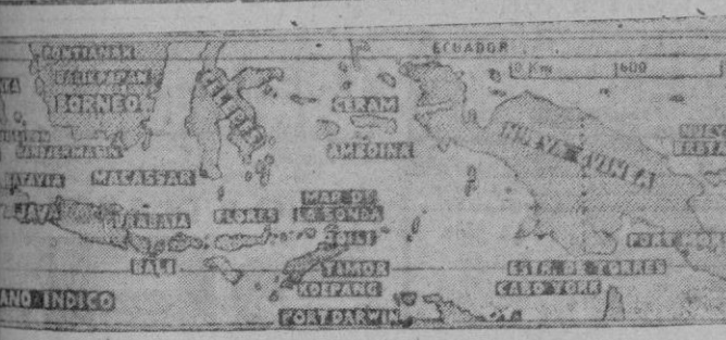
Principales puntos donde se desarrolla la ofensiva japonesa

Este I Congreso de Ingeniería Industrial cuenta desde luego con el generoso apoyo del Caudillo, que reiterando su interés por los problemas importantes que el país tiene planteados, ha aceptado el alto patrocinio del Congreso, de cuya Mesa da honor a parte los Ministros cuyas actividades están relacionadas con la ingeniería industrial.