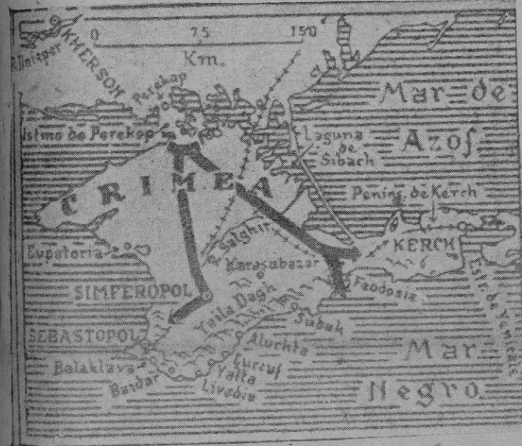
La conquista de la península de Crimea. — Las líneas y las flechas indican los avances realizados por los alemanes.