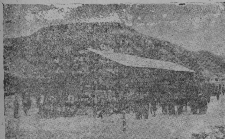
Capilla provisional en Paracuellos del Jarama, que ha sido construída junto, al lugar donde reposan los restos de los doce mil caídos