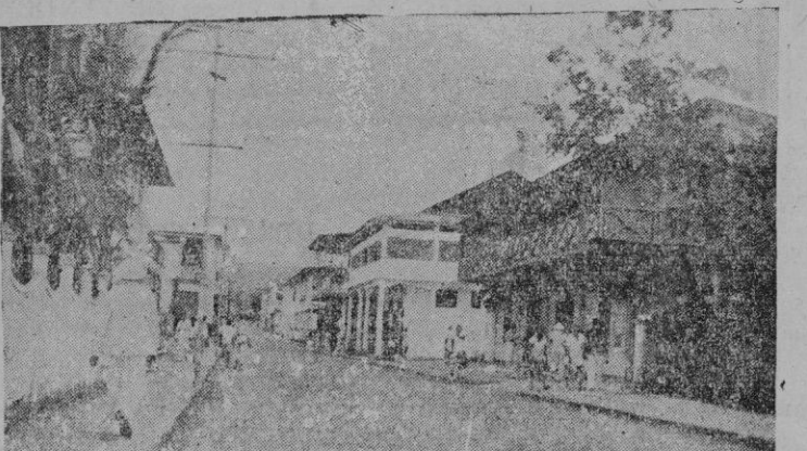
La calle del general Franco

Todos los cruces son peligrosos, en estas calles céntricas isabelinas, en que abundan los vehículos, camiones principalmente, y los peatones; en las que os están reclamando la atención muchos establecimientos comerciales que exponen y proclaman la vitalidad mercantil de la isla.