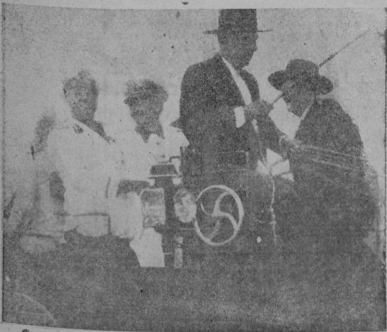
El Conde Ciano y el Ministro de la Gobernación en el típico coche andaluz al dirigirse a la fiesta campera con que fué obsequiado el Conde Ciano en Sevilla