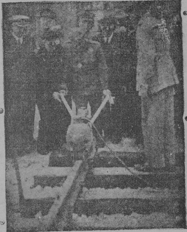
La Coruña. — El Generalísimo coloca por sí mismo los tornillos de un riel en el nuevo ferrocarril a Zamora.

A esa Institución le da aliento y protección el ilustre Almirante señor Basterreche, que durante su mando en Mallorca tuvo oportunidad de conocer la primera de estas Escuelas prestándole su colaboración. En el crucero que realiza el "Ciudad de Alicante" con los marineritos de Cádiz, de Sanlúcar, de Málaga, Algeciras, Huelva, Barcelona y Sevilla van también los de Palma, los del "Felipe Crespi". Asoman en la cubierta como una bandada de gaviotas recibiendo en cada puerto el homenaje de simpatía de un pueblo que ve en esos marineritos una juventud admirable con materia prima de héroes, que han de cubrir en un mañana aquellos puestos en los que han de laborar infatigables por el porvenir de la flota española, con todo el rendimiento de esas Escuelas de Flechas Navales, escuela para marinos, forja de buenos patriotas, cuna de la milicia en la nueva España que enseña a obedecerla, a servirla.