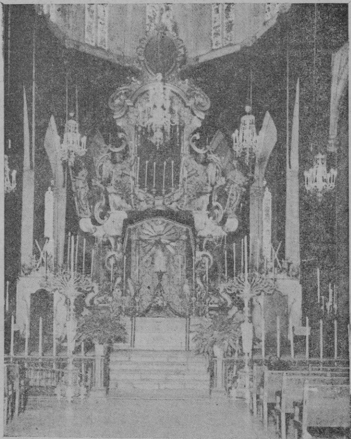
Aspecto que ofrecía el altar mayor de la iglesia de Santa Eulalia, con la venerada imagen del Santo Cristo, que fué colocada allí para la solemne función del domingo

El domingo en la iglesia parroquial de Santa Eulalia, se celebraron solemnes actos en honor del Santísimo Cristo del Milagro, con motivo de la Victoria y feliz retorno de muchos que marcharon al frente y de suplir para el eterno descanso por enantos dieron su vida por Dios y por España.