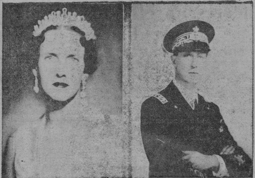
Boda de príncipes. — El duque de Spoleto y la Princesa Irene de Grecia, que en breve contraerán matrimonio

do lo has hecho porque estaba el mundo sobre la trilita no podías sufrir que la Europa cayera del Toro; e en tu tumba crujieron los huesos del Cid y Don Carlos;