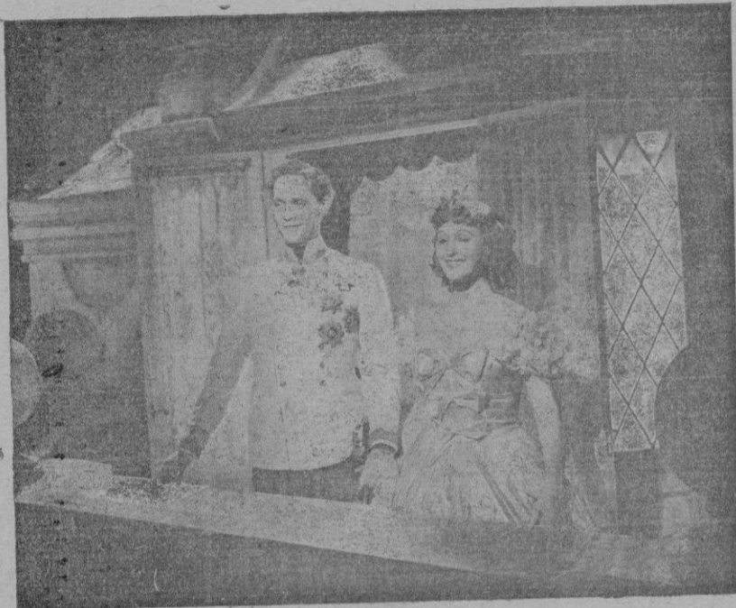
GRACE MOORE y FRANCHOT TONE en una escena de la magnífica película de Columbia "LA PRINCESA ENCANTADORA" que se estrenará mañana en el TEATRO PRINCIPAL