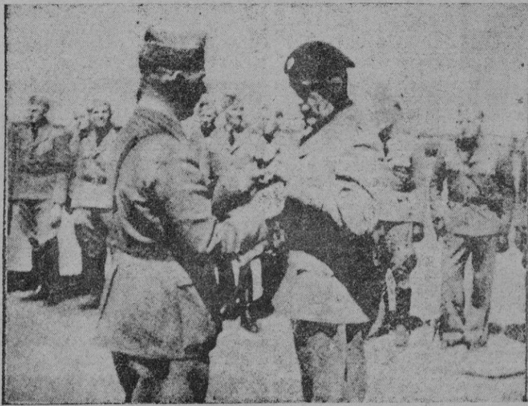
En la despedida a la Legión Cóndor. — El general Richthofen impone condecoraciones españolas a los heroicos aviadores