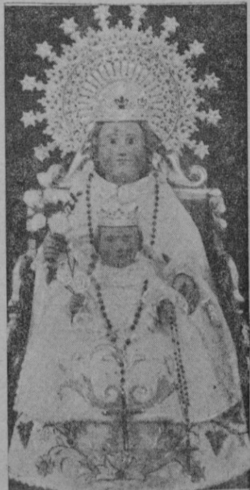
Ntra. Sra. de Bonany (Petra)