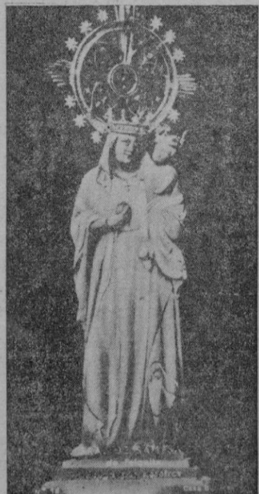
Ntra. Sra. de S. Salvador, de Felanitx