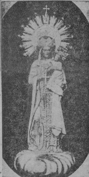
Nuestra Señora de Cura