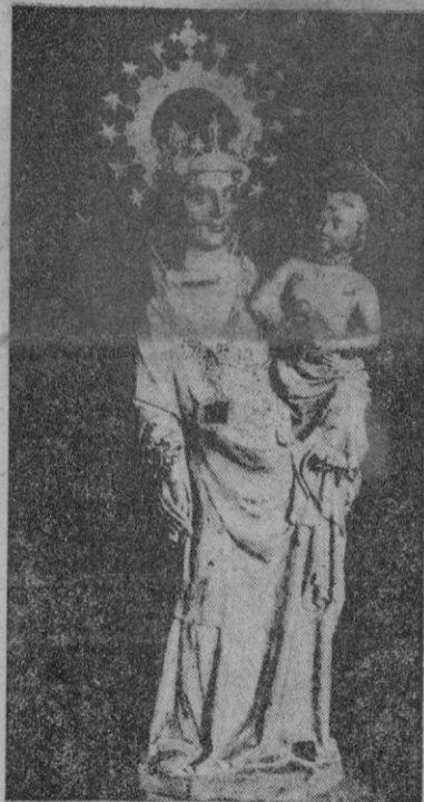
Ntra. Sra. del Puig, de Pollensa

Las Fiestas de la Victoria. Resplandor infantil que en plena primavera ha cubierto la ciudad entera de mirto y bayas, de arcos y banderas, de flores y de luces. Jamás se había visto una eclosión del entusiasmo general tan ingente de luz y de color. Flota el ambiente como una vibración de pecho a pecho y aflora a gargantas hecho palabras estentóneas: Franco! Franco! Franco! ¡Viva España! ¡Arriba España!