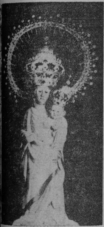
Nuestra Señora de la Salud

Bien venidas seais Imágenes benditas de nuestra Madre y Reina!