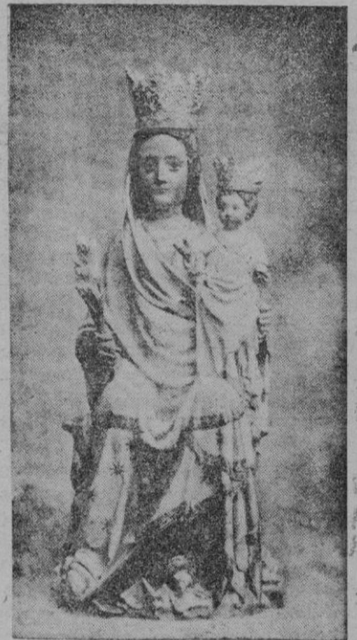
Santa María la Mayor, de Inca