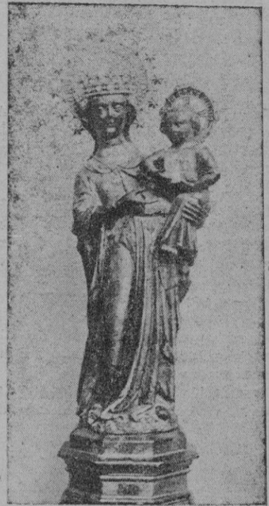
Nuestra Señora de Lluch