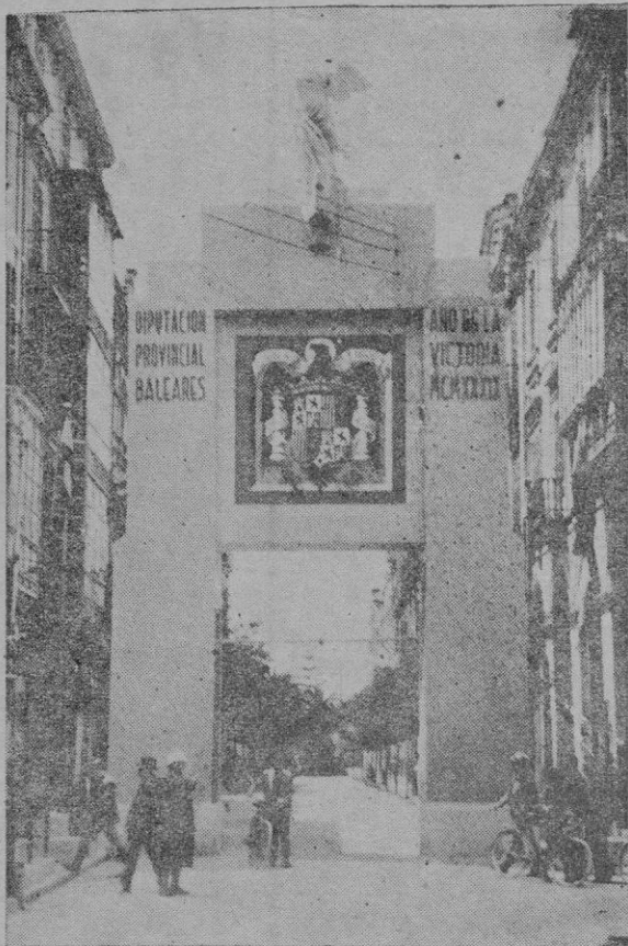
El artístico arco levantado por la Diputación en la calle de Palacio