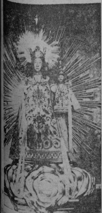
Ntra. Sra. de San Salvador de Artá