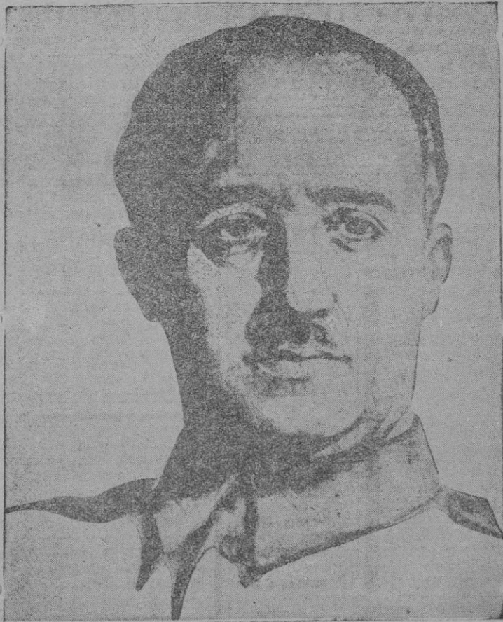
El Generalísimo Franco, admirable artífice de la victoria

En Extremadura, sector al Sur de Monterrubio, han continuado nuestras tropas rectificando la línea a vanguardia y ocupando las posiciones enemigas no obstante la resistencia opuesta por los rojos, que han sufrido nueva derrota con enormes pérdidas. En una de las posiciones que ocupaban fueron hoy envueltos y aniquilados otros tres batallones