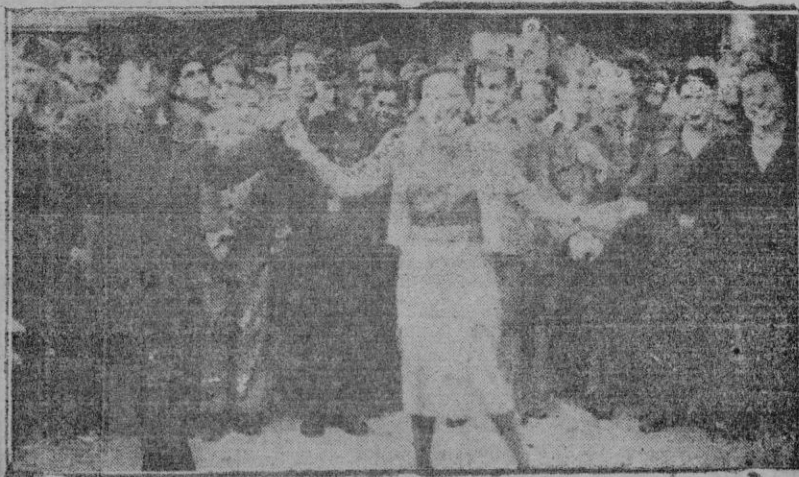
Bailando sardanas en la Plaza de Cort

Es tan grande el hecho que no podemos, el que el Caudillo en contadísimos