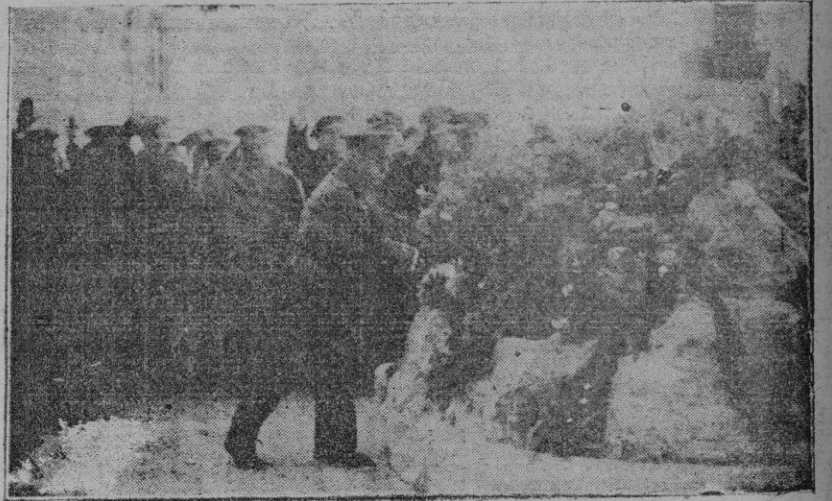
El Sr. Comandante Militar depositando una corona en la Cruz de los Caídos