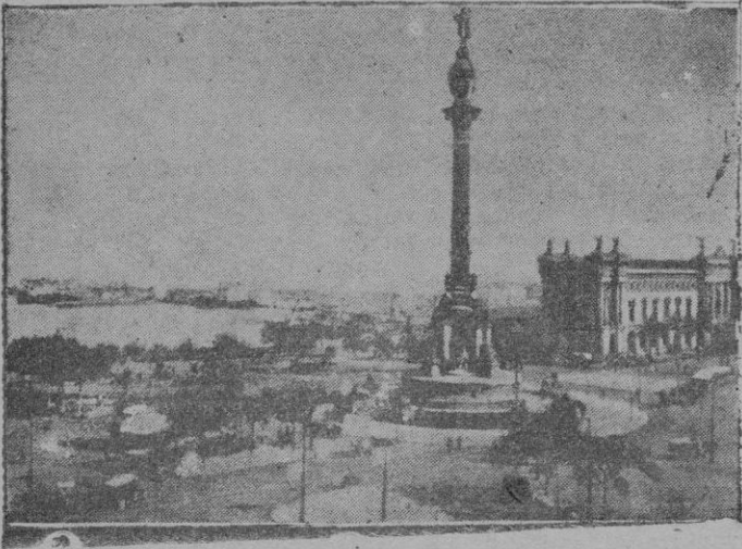
El monumento de Colón y puerto de Barcelona

materiales, en cambio en los soldados de Franco late el espíritu patriótico y nacional, que ha sido la llave de la victoria.